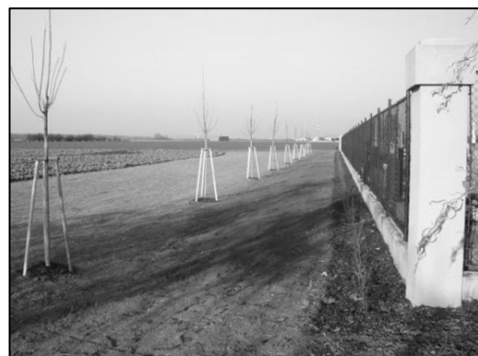
Za zdí hřbitova byly osázeny keře a stromy.

síní poskytnou návštěvníkům hřbitova v létě příjemný stín. Součástí úprav jsou i čtyři nové lavičky. Dvě jsou umístěny u kříže výměnou za lavičky stávající a dvě