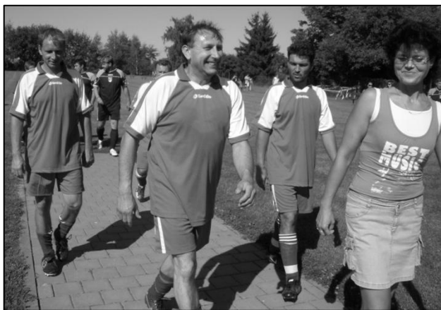
Úsměv na tvářích hráčů Kyselovic po vítězném utkání s družstvem z Vlkoše. Spokojeni byli i fanoušci.

V letošním roce to bylo právě 30 let, kdy na popud dnes již zesnulého