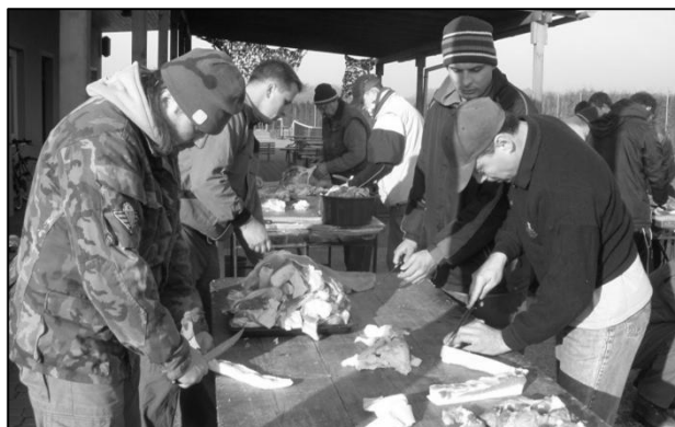
Zabíjačka představuje především velké množství práce a je k tomu třeba obětavých, šikovných mužů. Jak je vidět, ti v sportovním klubu jsou.

Ano, zabíjačka se letos změnila v zabíjačkové hody. Změna již třetí úspěšné akce Sportovního klubu Kyselovice spočívala v tom, že zabíjačka, tedy samotné zpracování produktů, proběhlo den předem, tedy v sobotu. Už v pátek samozřejmě proběhla příprava – vaření krup, loupání cibule, česneku a zeleniny. V sobotu měli fotbalisté sraz ve