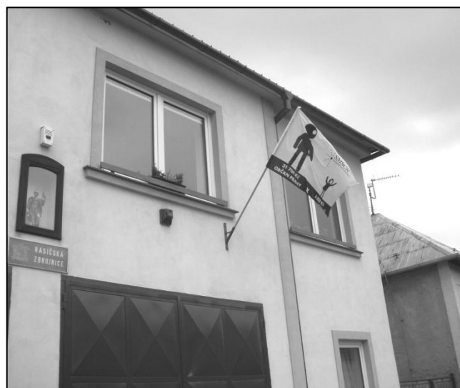
Vlajka na budově obecního úřadu stále vlaje.