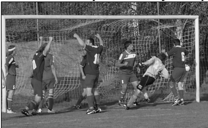
Míč v síti hostů a ruce nad hlavami našich. V domácím zápase odehraném 18. září proti Morkovicím B zvítězily Kyselovice 4:1.

Po krátké letní přestávce jsme v polovině července začali přípravu na novou sezónu. Přípravu nám obohatily pohárové zápasy s Kvasicemi a Šelešovicemi.