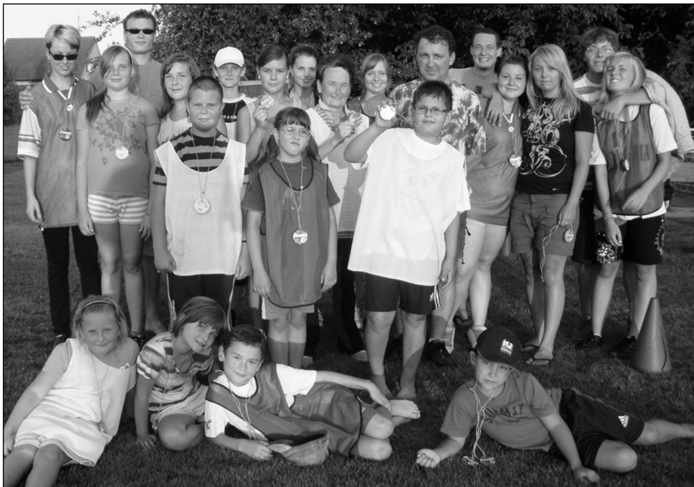
V oblíbeném brännballu smíšených družstev nakonec zvítězili žlutí. Odměnu v podobě medaile z fidorky dostali všichni.