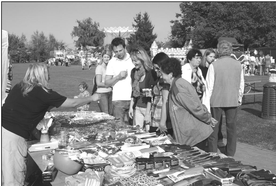
Kyselovské hody přilákaly do sportovního areálu velké množství hodovníků. Zásahu na tom mělo nezvykle pěkné počasí a také množství atrakcí.

O hodovém víkendu 30. září-2. října 2011 přilákalo krásné počasí plno lidí do sportovního areálu v Kyselovicích. Po dlouhé době k nám přijely pořádné kolotoče, tak si užili malí i velcí. Na jarmark ve sportovním areálu napekl Spolek nápaditých žen domácí hanácké vdolky a připravil další občerstvení. Bylo možné nakoupit cukrovinky, cukrovou vatu, medovinu, ale i různé praktické výrobky. Letošní hodový víkend se vzhledem ke krásnému počasí opravdu vydařil. V pátek zahájili program sportovci hodovou zábavou v R-Klubu a v sobotu odpoledne sehrál místní B tým fotbalové utkání se soupeřem z Kvasic. V neděli program vyvrcholil slavnostní mší svatou v místním kostele Sv. Andělů Strážných, za doprovodu smíšeného pěveckého sboru Občanské besedy Kyselovice a odpoledním jarmarkem ve sportovním areálu.