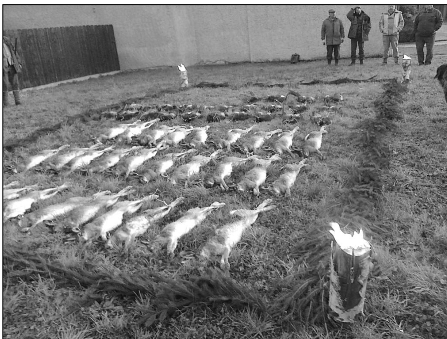
Výřad hlavního honu myslivecké společnosti ze soboty 10. prosince 2011.

zvěř posuzuje komise a hodnotí, zda byl proveden správný odstřel. Tím chci uvést na pravou míru, že se loví podle určitých mysliveckých pravidel a zákona a ne tak, jak někdy zaznívá, že myslivci loví vše, co vyleze.