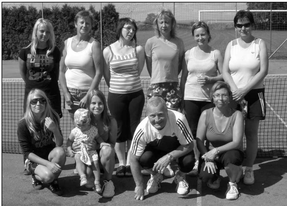
Na společném snímku jsou všichni účastníci závěrečného turnaje tenistek v Kyselovicích.

V letošním roce se po tříleté přestávce opět otevřela tenisová škola