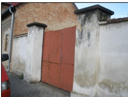
Dřívější ne příliš zdařilá výměna dřevěných vrat za plechové.