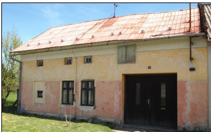
Dům v Kyselovicích čp. 145, dříve Opšalovo, nyní Kachmanovo.

Většina domů v Kyselovicích si ve své hmotě udržela původní dispozici, ale usedlosti se nevyhnuly stavebním proměnám druhé poloviny 20. století, včetně současných úprav. Je zde ovšem i celá řada budov, jež si uchovaly prvky tradiční stavební kultury. Nedošlo k radikálním inovacím, uchovaly si výškovou hladinu stavby a zásadně se nezměnila dispozice domu. Proměny se týkaly hlavně průčelí objektů (fasády, okenní výplně, vstupní dveře do síně, nebo vrata do dvora atd.), kdy se uchovaly více či méně tradiční stavební projevy. Z těchto staveb to jsou například čp. 5, 6, 9, 10, 13, 18, 19, 39, 40, 42, 43, 44, 45, 48, 57, 59, 60, 67, 68, 87, 89, 93, 99, 112, 118, 123, 129, 132, 133, 135,