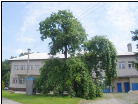
Jasan vyžadoval z bezpečnostních důvodů zásah.

Od roku 2011 spolupracuje Obec Kyselovice s odbornou firmou na ošetření vzrostlých stromů. Její pracovníci, tzv. arboristé, provádí ořez stromů pomocí stromolezecké techniky. Zásahy provádí co nejšetrnějším způsobem, aby byl co nejvíce zachován přirozený vzhled stromu. V roce 2011 prohlédli všechny stromy na veřejných prostranstvích obce a postupně budou provádět jejich údržbu. V roce 2011 byl proveden zdravotní řez lípy na návsi před školou, bezpečnostní řez jasanu u mlékárny a výchovné řezy mladých lípek na návsi.