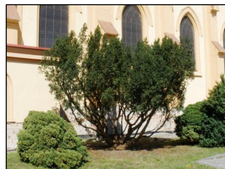
Tis u kostela po zásahu odborníka.

kostela a ošetřeno bylo dalších 7 stromů. Tak budou postupně ošetřeny všechny stromy na veřejných prostranstvích. S průběžnou údržbou stromů počítá obec i do dalších let s tím, že nejdůležitější je řez mladých stromů – tzv. výchovný řez. Výchovný řez se provádí u mladých stromů v prvních letech po výsadbě. Je jedinečnou možností zasáhnout bez rozsáhlejšího poranění až do kosterních větvení stromu a ovlivnit snadno a levně budoucí vzhled koruny. Provedením výchovného řezu se může majitel stromu vyhnout budoucím problémům.