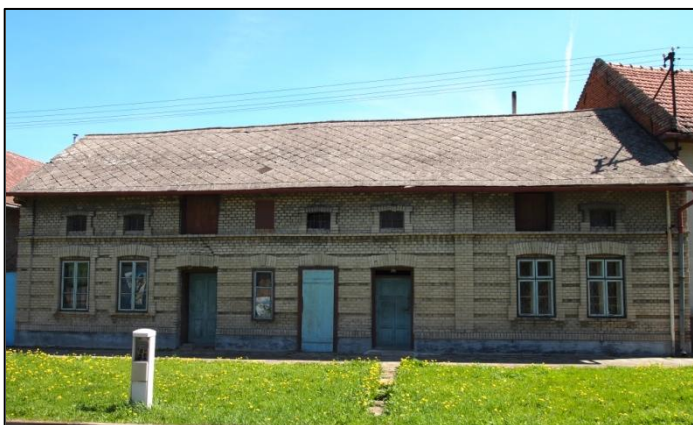
Dům na návsi v Kyselovicích čp. 66, Obadálkovo.