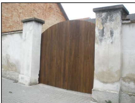
Při nedávné výměně se majitel vrátil k původnímu materiálu a tvaru.

Našli jste svůj dům mezi vyjmenovanými stavbami? Věříme, že stejně jako my máte zájem na uchování tohoto kulturního dědictví v naší obci a zvolíte citlivý přístup při opravách. Obec Kyselovice nabízí pomoc majitelům domů, a to odbornou ve formě konzultace s architektem a finanční pomoc formou úvěru. Jenom společným úsilím se nám podaří uchovat tvář naší obce pro další generace.