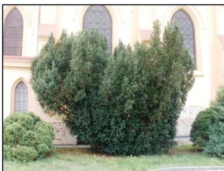
Tis u kostela před tvarovacím řezem.

V letošním roce prošel redukčním řezem tis u fary, tvarovacím řezem tis u