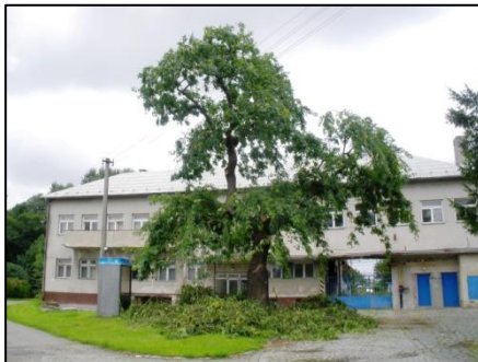
Jasan bezprostředně po řezu.

Od roku 2011 spolupracuje Obec Kyselovice s odbornou firmou na ošetření vzrostlých stromů. Její pracovníci, tzv. arboristé, provádí ořez stromů pomocí stromolezecké techniky. Zásahy provádí co nejšetrnějším způsobem, aby byl co nejvíce zachován přirozený vzhled stromu. V roce 2011 prohlédli všechny stromy na veřejných prostranstvích obce a postupně budou provádět jejich údržbu. V roce 2011 byl proveden zdravotní řez lípy na návsi před školou, bezpečnostní řez jasanu u mlékárny a výchovné řezy mladých lípek na návsi.