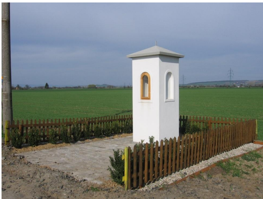
Boží muka opravené obcí Kyselovice v roce 2009 nákladem necelých 77 tisíc korun.