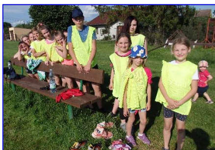
Žluté družstvo napadlo všechny síly k získání většího počtu bodů.

Sportovní odpoledne se tentokrát stalo první společnou akcí v Kyselovicích po koronavirové pauze. Tradiční páteční termín byl obsazen fotbalisty, kteří měli domluvené přátelské utkání s fotbalisty z Rusavy, takže sportovní akce byla přesunuta na sobotu 27. 6. 2020.