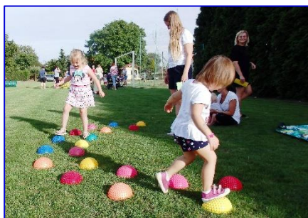
Pro menší děti byly na hřišti připraveny krásné cvičební pomůcky.

výkony razítka na kartičky, jejich starší kamarádi soutěžili ve hře MÖLKKY. Tato