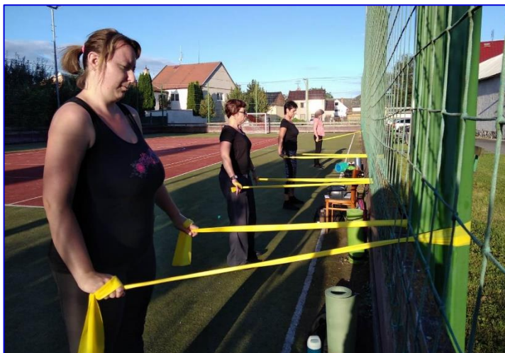
Při cvičení na víceúčelovém hřišti mohly ženy zajímavě využít nové posilovací pomůcky.