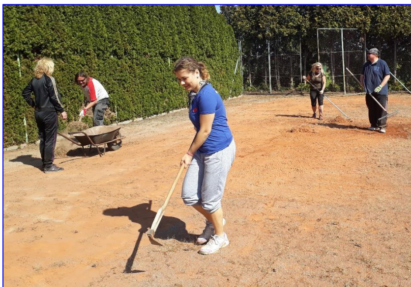
Jarní brigáda na přípravu tenisových kurtů.

Pěkně připravený tenisový kurt během sezóny nezháňel a byl stále v permanci, což nás těšilo.