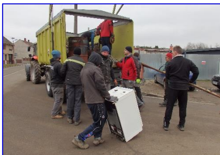
Velká účast fotbalistů při sběru železa

pod širým nebem užívaly cvičenky aerobiku žen. Přestože Medardova kápe tentokrát opravdu vydatně zalévala celé