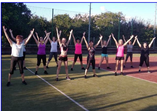
Letošní počasí ženám při cvičení pod širým nebem přálo.

Co se týká možnosti pohybových aktivit, tak můžeme zhodnotit, že nejpříznivější bylo pro nás léto. Po uvolnění opatření začaly koncem dubna cvičit venku na počasí přálo. Dle situace s počasím a jsme v květnu a červnu cvičily i v tělocvičně. Letní cvičící sezóna byla pro nás vydařená a bylo znát, že nám cvičení chybělo po psychické. Počasí nám přálo celé léto, kdy bylo plánované cvičení s profíky. Dvakrát byl domluvený termín a těmto počasím neporučíme, snad to vyjde