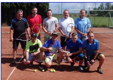
Tenisový turnaj Pilsner CUP 2020 se pro trvalý déšť dohrával v neděli za slunečného počasí.

Jako první z tenisových akcí se v sobotu 11. 7. 2020 uskutečnil turnaj „Pilsner CUP 2020“, a to pod záštitou místního R-Klubu. Jednalo se o turnaj v čtyřhře mužů, kterého se zúčastnilo pět párů. Hrál se na jednom kurtu, systémem každý s každým, takže nás čekal dlouhý tenisový den. Jelikož nám počasí nepřálo a kolem poledne začalo pršet, poprvé se turnaj hrál dva dny. Náhradním programem prvního dne se stal stolní hokej a výtečné občerstvení při-