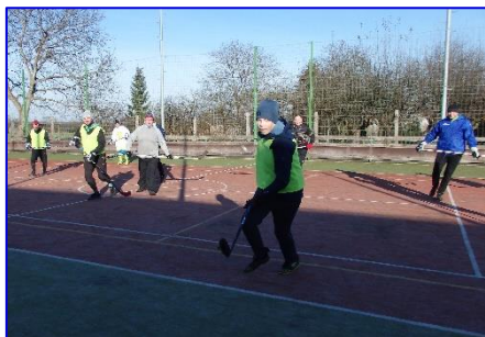
Fotbalisté si v zimě udržují fyzickou kondici na víceúčelovém hřišti.

Jarní sezóna se bohužel díky pandemii nedohrála a čekalo se, co bude s fotbalem dále.