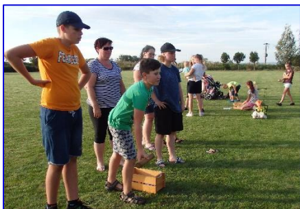
Hráči starší kategorie turnaje ve hře mólky.

V pátek 27. 8. 2020 proběhlo na hřišti SK Kyselovice rozloučení s prázdninami, které byly pro většinu z nás ty nejdělsí, jaké jsme kdy zažili. Sportovní klub měl v plánu uspořádat turnaj ve hře MÖLKKY, který byl u této příležitosti rozšířen o další program, aby se mohlo zapojit co nejvíce účastníků. Pro menší děti do šesti let, kterých je v současné době v Kyselovicích početně, byla na hřišti připravena stanoviště