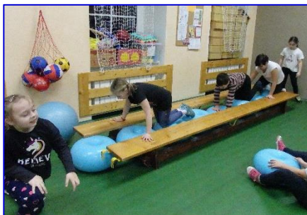
Děti si cvičení v tělocvičně užily jen do jara, na podzim se už sešly jen jednou.

Cvičení mladších žáků skončilo kvůli pandemii koronaviru v březnu 2020. Na podzim jsme stále čekali, jak se situace vyvine a nechtěli jsme jednu středu začínat a druhou hned zase končit. Dětem však cvičení evidentně chybělo, při každém setkání se ptaly, kdy už tedy začneme, a když jsem jednou na otázku „Bude cvičení?“ kývla (v domněnání, že jakmile se situace ustálí, určitě bude), děti samy mezi sebou rozšířily zprávu, že tedy bude a hned následující