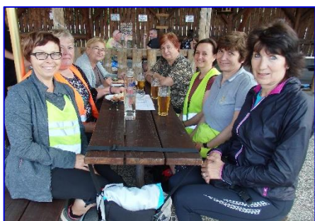
Cvičení pro zdraví ukončilo cvičební sezónu výletem do restaurace na chropynském koupališti.

Cvičenky zdravotního cvičení jarní sezónu, přerušenu koronavirovou pandemií, ukončily začátkem prázdnin společným výletem na kolech. Tentokrát jen do Chropyně, do restaurace Racek na koupališti. Prázdniny pak utekly jako voda a začaly se chystat na další školní rok. Podzimní sezónu opět zahájily výletem na kolech, tentokrát ke Kryštofovi do Zářičí. Otestovaly kuchyni nového majitele, a to k jejich plné spokojenosti. Zde také kolektivně naplánovaly termín prvního cvičení a těšily se