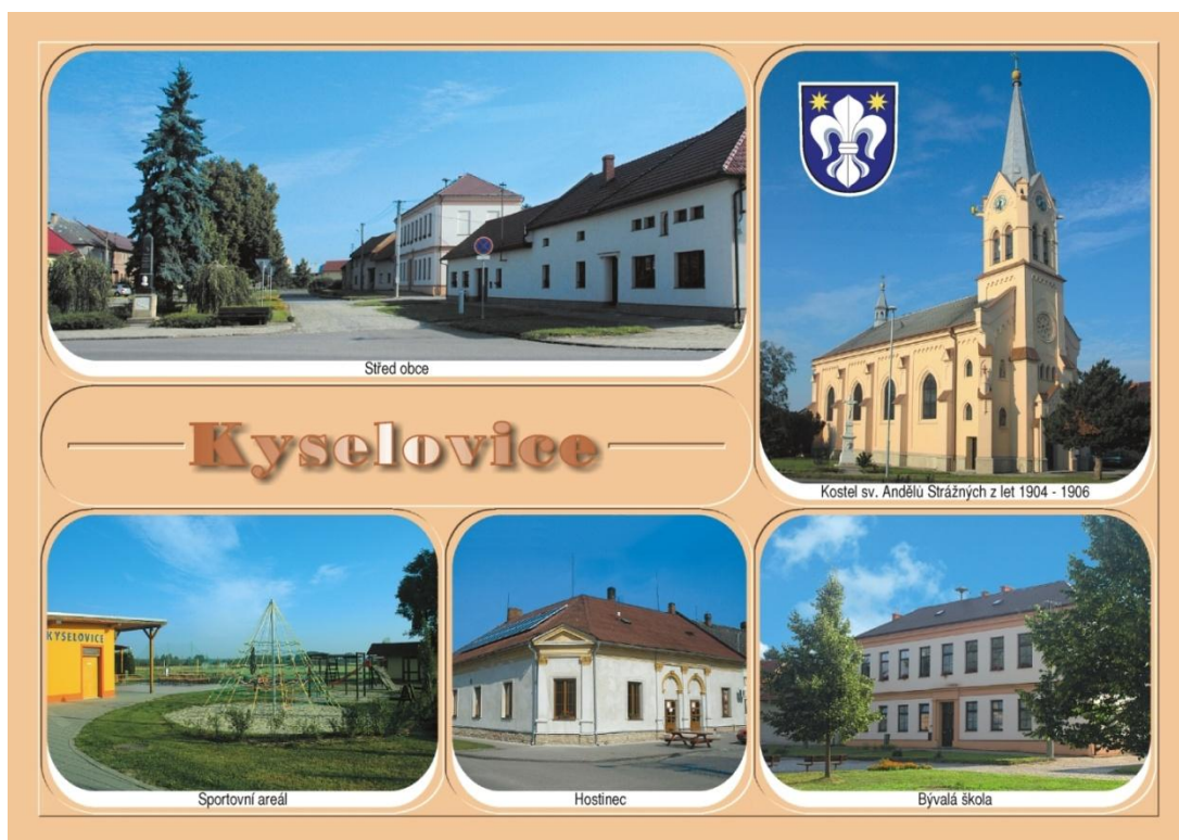
Pohledni se zaměřením na obec.

Budovu školy a domy na návsi jsme doplnili fotografií sportovního areálu, ale poslední fotografie byla oříšek.