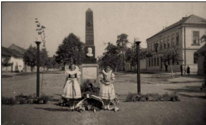
Slavnost osvobození 11. 8. 1947. Na snímku návsi z roku 1947 jsou vidět hrušně vysázené roku 1898.

takže možno kojiti se nadějí, že zahrady naší obce v budoucnu ponесou větší užitek, a budou více oceněny než doposud. Jest potřebí začít od mladší generace a tuto nabádati k lásce k ovocnému stromoví, neboť ovocné stromoví jest hospodářským základem každého majitele sadu. Za poslední tři