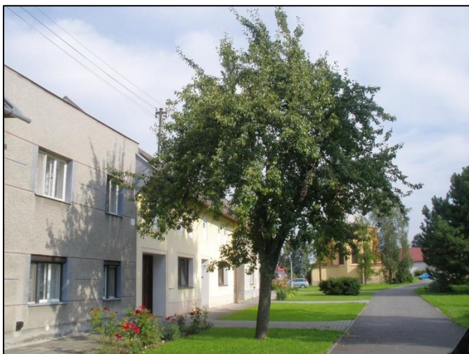
Poslední hrušeň na návsi za kostelem.

založenou 80 - 110 cm nad zemí. Takové stromy dávají sice intenzivní úrodu, avšak vyžadují častější aplikaci chemické ochrany a jejich životnost je cca 20 let. Polokmeny a vysokokmeny naproti tomu dobře kotví, lépe si hledají vodu i živiny a jejich životnost dosahuje několik desítek let. Dávají tak užitek několika generacím pěstitelů a také jsou krásné a na vesnici vždy měly své místo. Staré ovocné odrůdy jsou navíc nenáročné na pěstování.