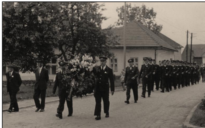
Hasiči 1959. Na snímku z roku 1959 jsou vidět hrušně naproti kostela.

místo bývá každoročně posázeno květinami a ve výročí našeho osvobození 28. října vhodně upraveno a ozdobeno. V poslední době počínají i mladí hospodáři všimati si svých zahrádek a rádi vysazují ovocným stromovím příhodná místa. Každoročně doplní naše sady,