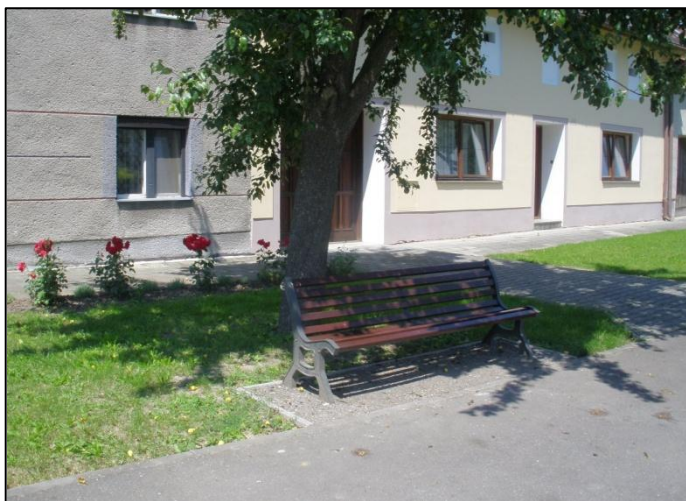
Lavička ve stínu staré hrušky – typický obrázek venkova.