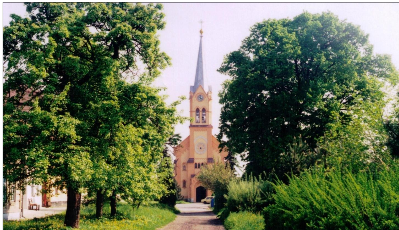
Severní náves. Ještě nedávno hrušně na návsi rostly. Rušivě zde působil spíše „živý plot“.

Z pamětní knihy obce Kyselovice str. 72.