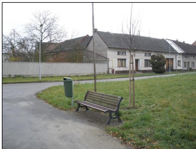
Lavička pod novou hruškou, vysázenou v roce 2013.