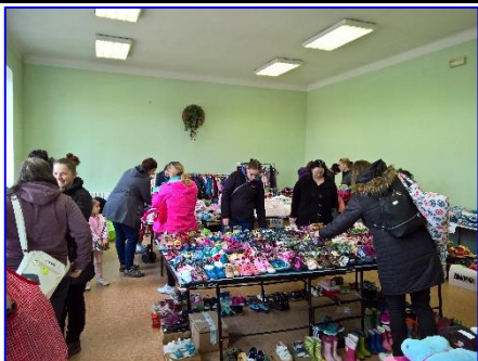
Organizace klubíku je pro mne s příchodem třetího potomka mnohem složitěj-

ší. A moc mne mrzí, že se už klubíku nestíhám tolik věnovat. Ráda bych obnovila pravidelné střední schůzky v tělocvičně od 9:30-11 hodin. Proto pokud by některá z maminek měla chuť mi s tím trošku pomoci, byla bych moc ráda. Narodilo se spoustu nových miminek a byla by škoda, kdyby klubík přestal fungovat. V této souvislosti vznikla i myšlenka, co udělat s výtěžkem z bazárků. S maminkami jsme se tedy rozhodly, že část výtěžku věnujeme mateřské školce. Po poradě s paní ředi-