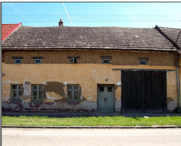
Usedlost č. 171. Jeden z domů reprezentující původní stavitelství v obci