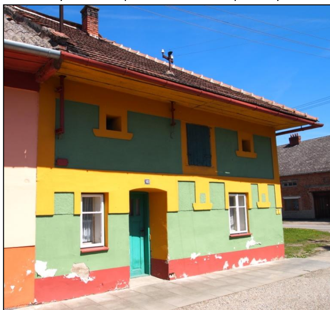
Domek u silnice ve směru na Chropyň číslo popisné 103