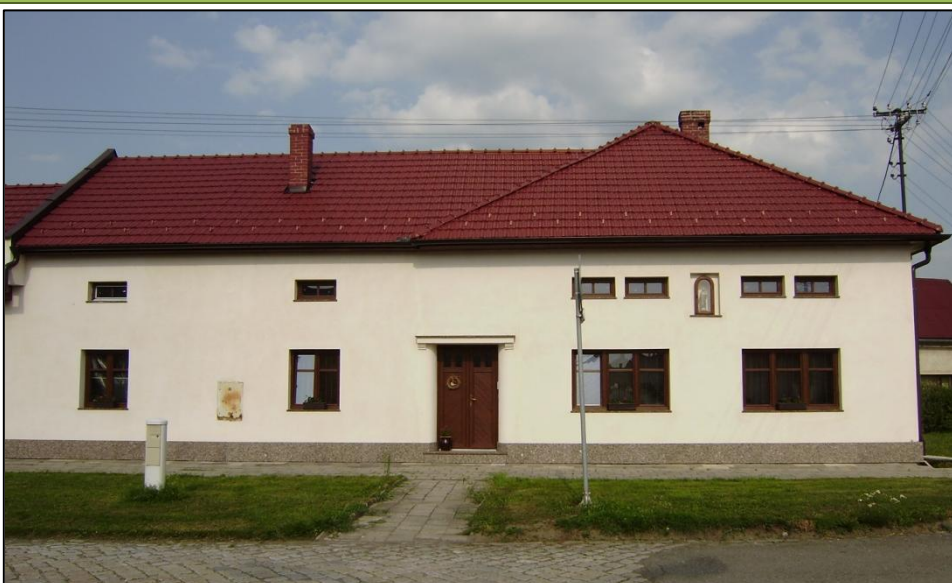
S citem upravovaný dům na návsi číslo popisné 63

V obci, zejména na návsi, se nachází zachovalé obytné domy a hospodářská stavení, která jsou dokladem vkusu a citu prostých lidí. Každý takový dům je potěšením nejen pro majitele samotné, ale i pro kolemjdoucí. Je důležité si krásu těchto stavení uvědomovat a zachovávat ji. Jsou ukázkou pokory a lásky prostých lidí ke svému rodnému kraji a ke své profesi. Program obnovy vesnice je jednou z posledních příležitostí ukázat krásu domků, jejich přirozené proporce, propojení s přírodou, používané materiály, členění fasád, fortelně zpracované stolařské a tesařské prvky.