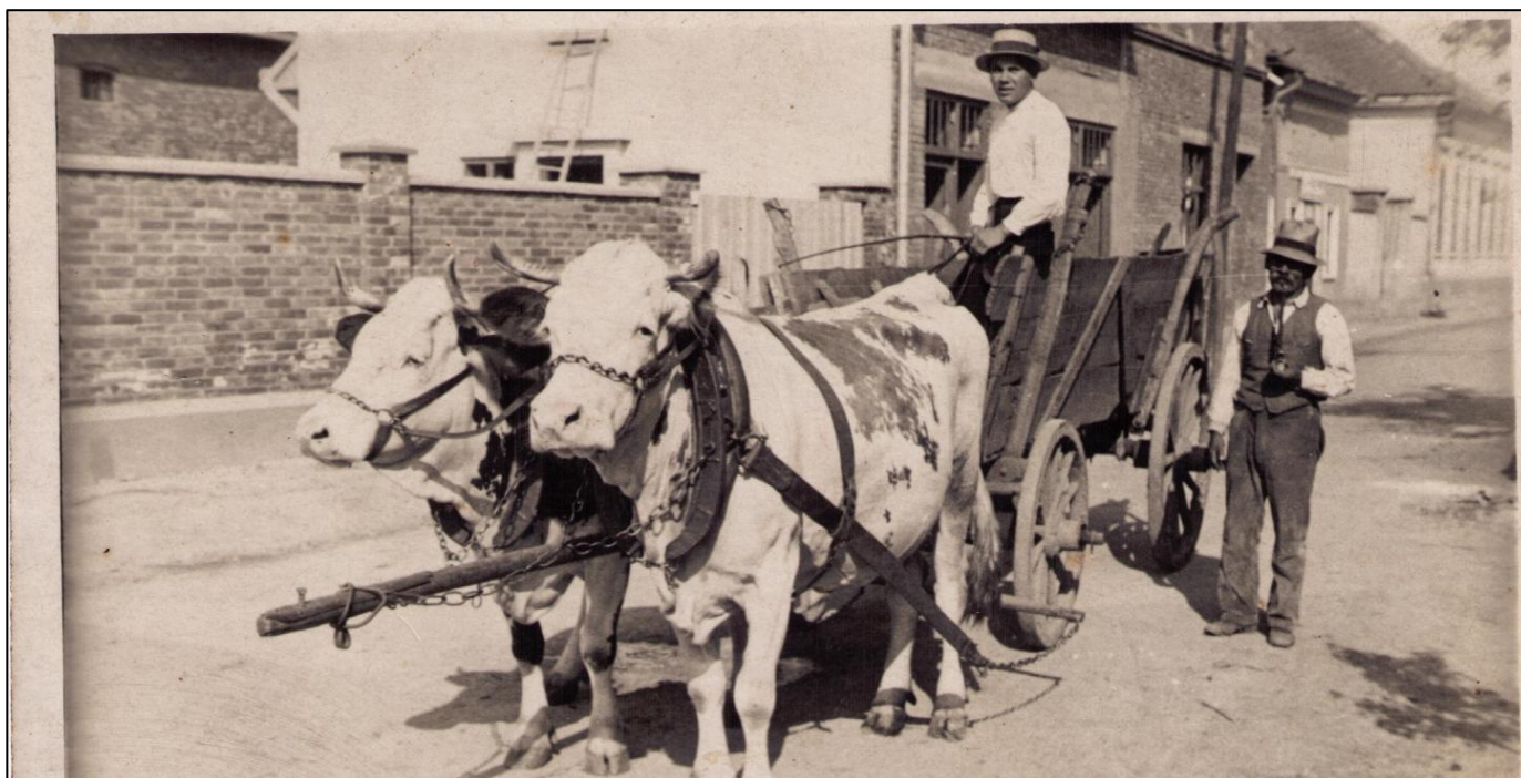
A takto se před lety u nás žilo. Za koňským povozem bývalý obchod u Hasmundů čp. 122.