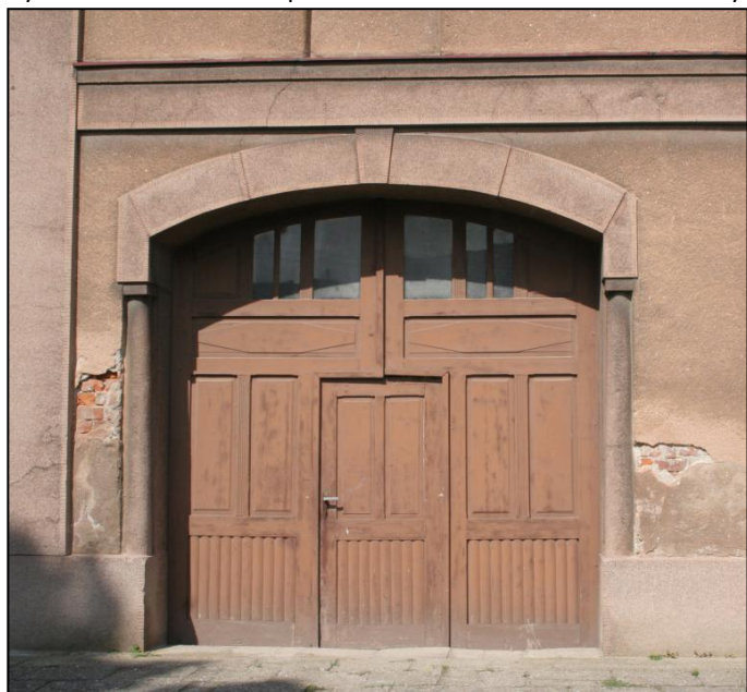
Vrata domu na návsi číslo popisné 16

tradic hliněných špýcharových domů s boční orientací typických pro oblast Hané. Vlivem tohoto uspořádání má převážná část domů výškově dvoupodlažní charakter. Postupnými přestavbami domů a využíváním původních komor pro obytné účely