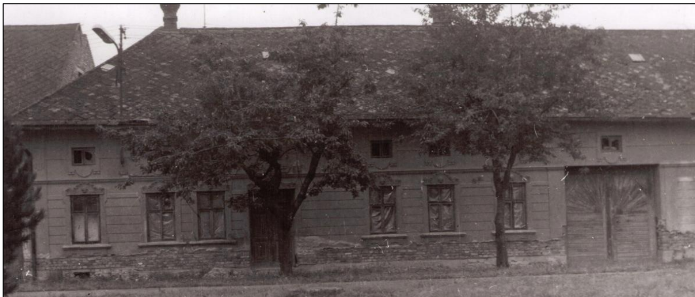
Dům na návsi s architektonickými prvky ve své tradiční podobě. Nad každým oknem byla hlavička andělíčka. Je to část domu čp. 51.