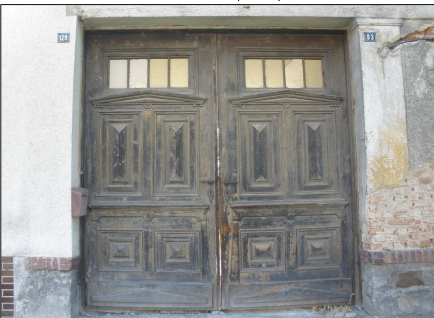
Bohatě zdobená vrata domu číslo popisné 129.

tzv. šambrán není možné ponechat na fantazii stavebníka, ale volit profily osvědčené (vytvořené zednickou šablonou nebo prodávané hotové fasádní prvky). Podobně střizlivě by měly postupovat stolařské dílny při výrobě vstupních dveří a vrat. Ušetřit si čas s vymýšlením nových vzorů a energii věnovat řemeslnému zpracování, inspirovat se svými dřívějšími předchůdci.