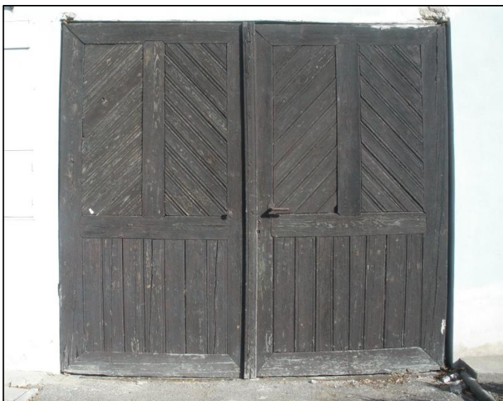
Vrata domu u silnice ve směru na Žalkovice číslo popisné 99