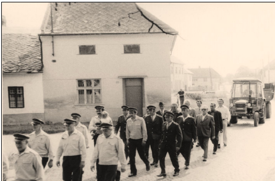
V pozadí průvodu je dům č. 139. Vlevo kousek obytné části. Dům je již ve špatném stavu.