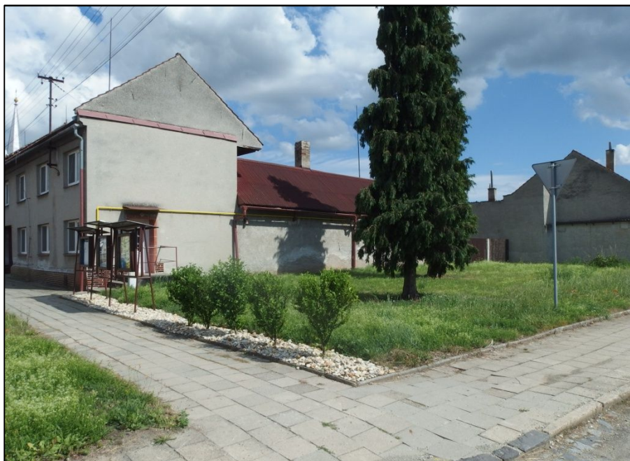
Současný snímek domu č. 140 Posišilovo, dnes Matulíkovo. Dveře byly původně z ulice, komín pekárny býval vyšší. Vepředu na dnes prázdném místě stávalo pekařství pana Jiříčka, o kterém píšeme v závěru tohoto článku.

Vojtěch Kučera z č. 112 vzpomínal, že jejich stařenka vstávala ve 4 hodiny, zadělala chleba a hodinu ho mísila. Těsto v ošatkách dala dětem na trakař a ty ho odvezly k pekařovi. Cestou ze školy vyzvedly upečené pecny a vzali domů. Pekl také „mašinové vdolky“, které rozvážel do domů. Svědkové