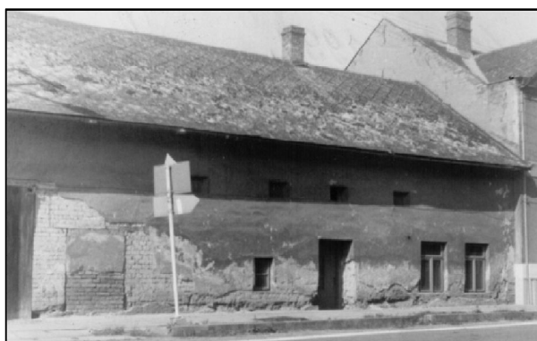
Na velmi zajímavém snímku je dům č. 21. Opadaná omítka prozrazuje zazděné dveře do obchodu.