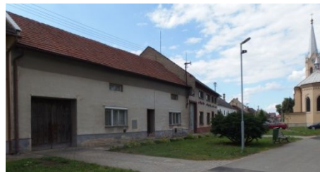
Současný pohled na dům č. p. 43 Kučerovo, dříve Kuschnerovo.