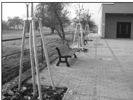
Nová dlažba před obřadní síní.

V roce 2011 obec realizovala projekt Obnova hřbitova II. etapa, kdy byla obnovena dlažba před obřadní síní, obnoven přístupový chodník a vysazena zeleň – kolem i uvnitř hřbitova. Pořízeny byly také čtyři nové lavičky. Nově restaurována a zároveň přestěhována na nový základ byla socha