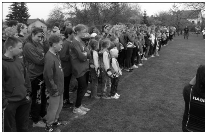
Obnovená soutěž mladých hasičů O zlatou proudnici Hané je velmi úspěšná. Letos se jí zúčastnilo rekordních 48 družstev.

na prvních třech místech získala pohár. V silné konkurenci 20 družstev mladší kategorie se naše družstvo ve složení