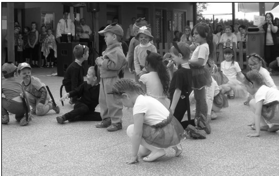
Na Dnu matek bylo k vidění mnoho různých vystoupení. Děti z Mateřské školy Kyselovice předvedly Kočíí taneček.