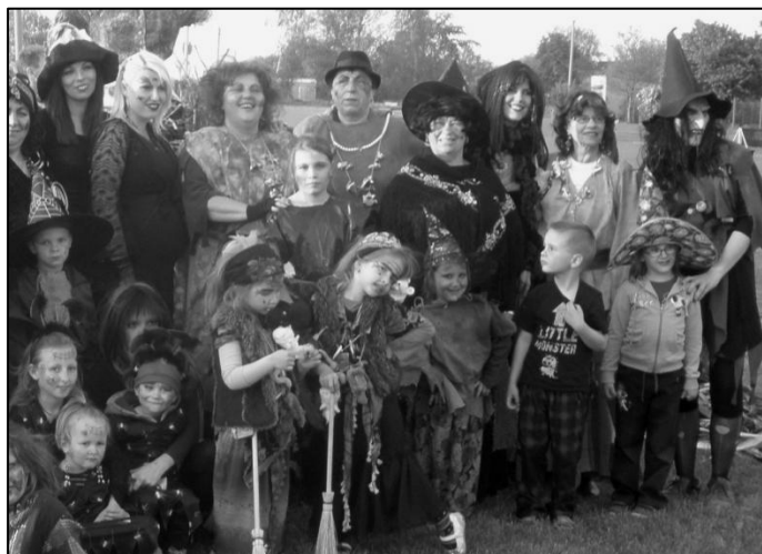
Část účastnic sletu čarodějnic v areálu sportovního klubu.

úkoly, za které byly odměněny sladkostmi. Úkoly byly přichystány i pro starší účastnice sletu. Místní mládež postavila kolem 19 hodiny májku. Mladí a svobodní muži a