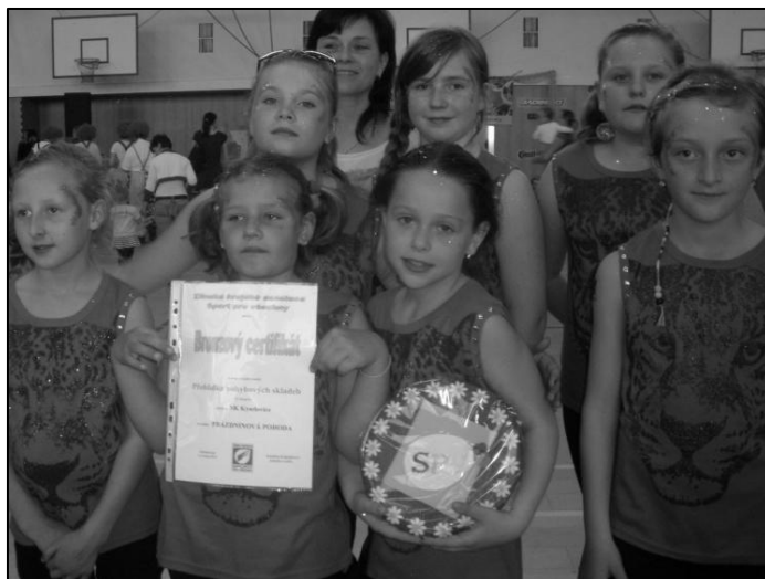
Na krajské přehlídce v Otrokovicích získala skladba mladších žákyň Prázdninová pohoda krásný bronzový certifikát.

Nacvičili jsme novou podíovou skladbu, na kterou si děvčata vybrala hudbu především od jejich oblíbené