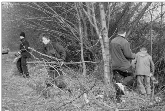
Brigádníci čistí náletové dřeviny kolem polní cesty podél Mlýnského náhonu.

Obec Kyselovice letos poprvé zorganizovala brigádu na údržbu krajinné zeleně. Reagovala tak na oprávněnou kritiku zemědělců, hospodařících v jejím katastru. V sobotu 15. února 2014 se ořezávaly stromy a čistily náletové dřeviny, které brání v průjezdu zemědělské technice kolem polní cesty vedoucí kolem Mlýnského náhonu (Říky) za zemědělskou farmou. Dřevní hmota byla na místě zpracovávána štěpkovačem. Brigádníci se opět rekrutovali z řad místních spolků. Kromě vlastního prořezávání, či odstranění dřevin bylo velmi namáhavé zapletené větve vytáhnout na volné prostranství, kde se