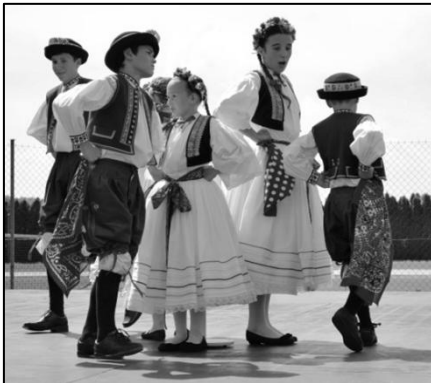
Kyselovické děti tancují v nových krojích.