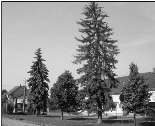
Stříbrný smrk na návsi náhle uhynul.

Zastupitelé byli seznámeni se závěrečným účtem a výsledkem hospodaření obce za rok 2013. Obec v roce 2013 přijala dotace ve výši 979.048 korun. Celkové příjmy za rok 2013 byly 7.543.616,44 korun. Celkové výdaje za rok 2013 byly 5.371.265,88 korun. Příjmy v roce 2013 převyšovaly výdaje o 2.172.350,56 korun. Z těchto příjmů byl zcela splacen krátkodobý bankovní úvěr z roku 2012 ve výši 1.400.000 korun. Zůstatek na běžných účtech k 31. prosinci 2013 činil 1.455.474,47 korun. Závěrečný účet obce byl schválen bez výhrad.