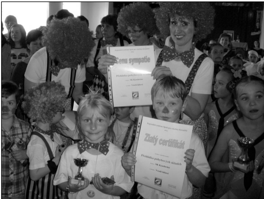
Rodiče s dětmi v Loukově vybojovali zlato, pohár a získali i cenu sympatie.

Na okresní přehlídku pohybových skladeb, tentokrát do Loukova, odjelo 46 cvičenců sportovního klubu se čtyřmi pohybovými skladbami v sobotu 12. dubna 2014. Na přehlídku se přihlásilo 10 skladeb, proto se místo sportovní haly v Bystřici p/H využily menší prostory kulturního domu v Loukově. Rodiče s dětmi předvedli v první kategorii skladbu „Veselí šášové“ autorky Leony Krčmové a jak už název