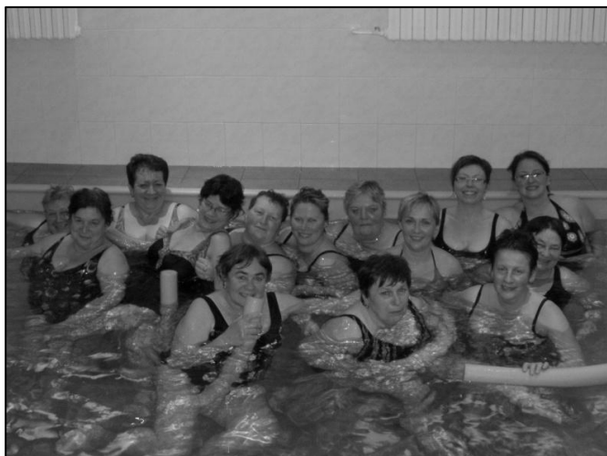
Nápadité ženy na společném snímku v aquacentru ve Zdoučkách.

speciální – s nápisem OBEC KYSELOVICE. Za dobře