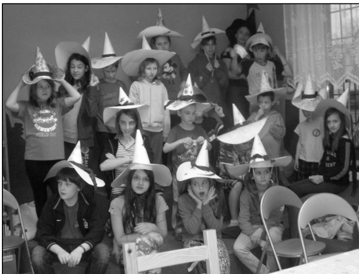
Vlastnoručně vyrobené čarodějnické klobouky na hlavách dětí, které prožily Noc s Andersenem v obecní knihovně.

Odchodem kouzelníka noc ještě dlouho nekončila. Noc v knihovně trávily děti ve věku 5 -15 let. Desetileté