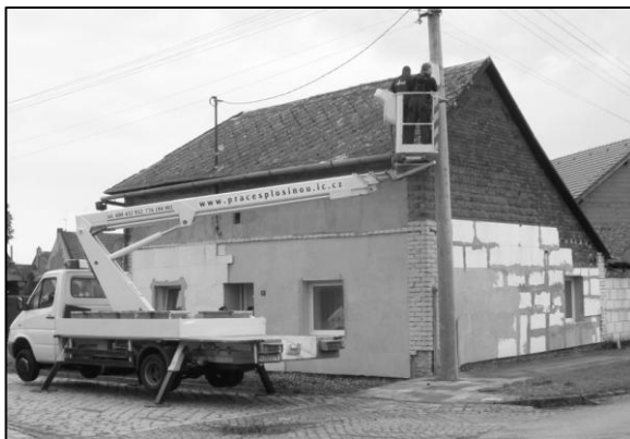
Montáž kamerového systému v blízkosti hlavní křižovatky.

Obec Kyselovice byla požádána Policií České republiky o součinnost v oblasti prevence kriminality. Tato součinnost spočívá v instalaci obecního kamerového systému v obci, jehož pomocí Obvodní oddělení Policie ČR Hulín má možnost sledovat a vyhodnocovat nápad trestné činnosti na vytypovaných rizikových místech v obci. Zastupitelstvo obce po projednání