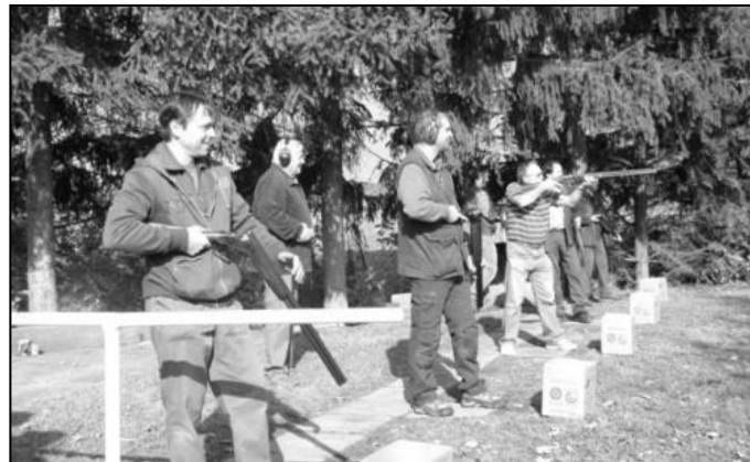
Kontrolni strelby MS Vlkos. Zastrilet si mohli i domaci.

dvakrát zasedla kontrolní komise. Myslivecká společnost na požádání Obce Kyselovice se při Oslavách výročí 935 let založení obce dne 15. června 2013 postarala o občerstvení na hlavním dnu těchto oslav. Podařilo se nám připravit jak důstojnou prezentaci LMS Kyselovice, pěkné stánky, tak i skvělou mysliveckou kuchyní. K mání byl srnčí guláš, divočák se šípkovou, divočák se zelím, divočák na smetaně, zapečené myslivecké klobásy na pivě a cibuli i klobásy z udírny. Tímto jsme se dostali do povědomí nejen místním občanům, ale také široké veřejnosti lidí z okolí, kteří se ve velkém počtu těchto oslav zúčastnili.