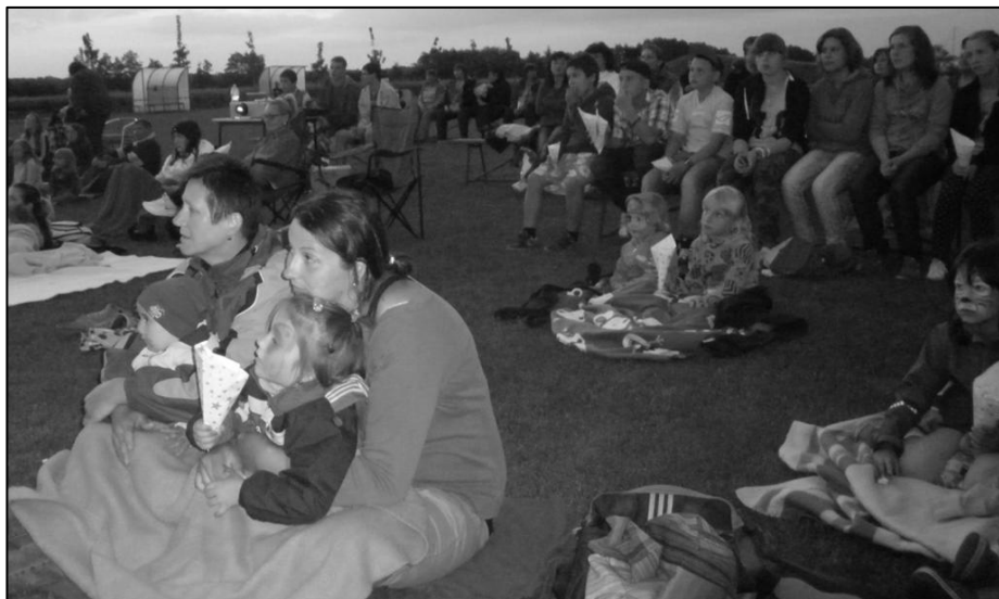
Dětský den zakončilo historicky první promítání letního kina na fotbalovém hřišti.

ale i organizátoři. Na víceúčelovém hřišti čekala na děti jízda zručnosti na koloběžkách – slalom, houpačka na prkně, přenášení hrníčků s vodou nebo projíždění úzkou brankou děti velmi