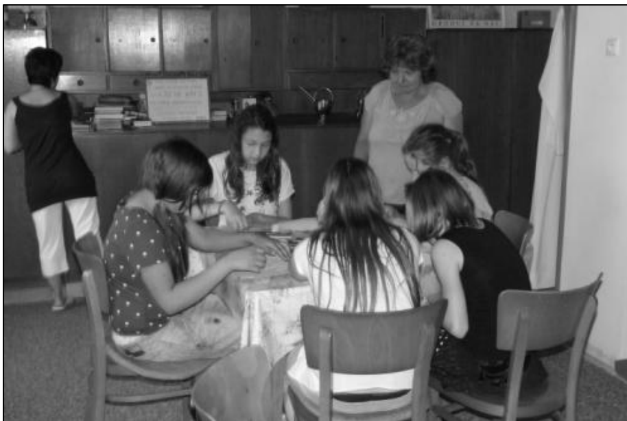
Děti se v sakristii při noci kostelů nenudíly.