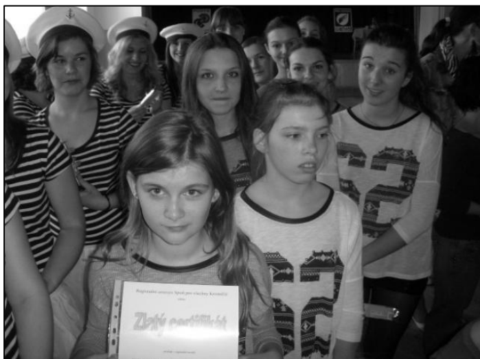
Na přehlídce v Loukově získala skladba starších žákyn Dance number 62 krásný zlatý certifikát.

Po novém roku se začala nacvičovat pohybová skladba pod názvem Dance number 62, které se zúčastnily všechny uvedené holky kromě Barbory Ondrašíkové, která měla zdravotní problémy. Celý kolektiv chodil s nápady a připomínkami, kterých si cením.