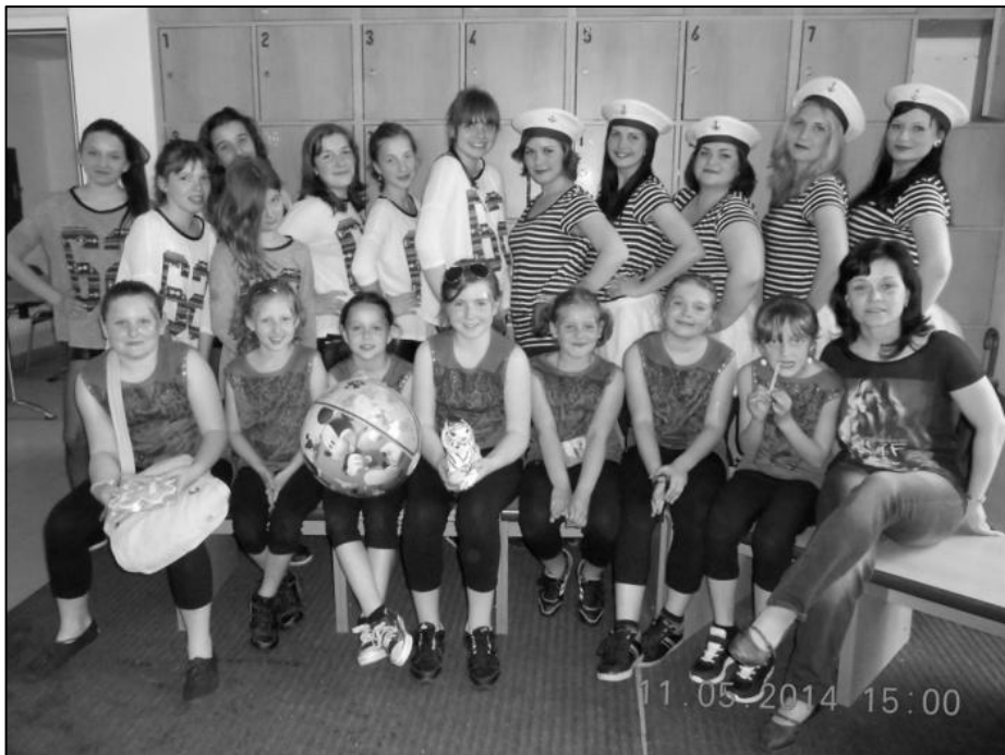
Výprava našich cvičenek na mezinárodní přehlídce.

V neděli 11. května 2014 se cvičenci ze Sportovního klubu Kyselovice zúčastnili 7. ročníku Mezinárodní přehlídky pohybových skladeb