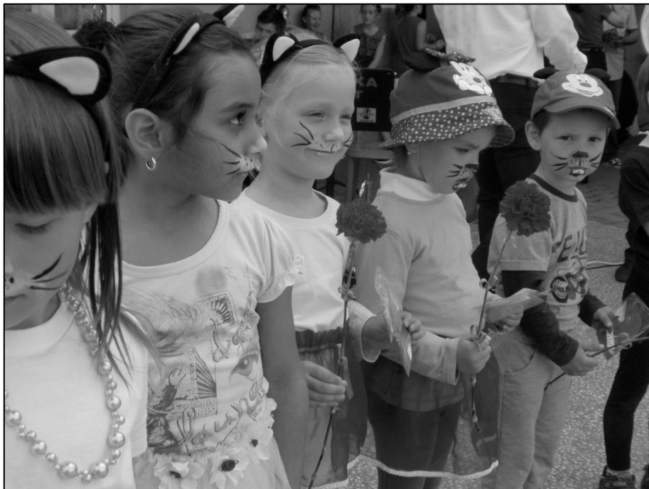
Děti s červenými karafiátky a dárečky pro své maminky na Dnu matek v Kyselovicích.

nám skončil školní rok a všichni se těšíme na prázdniny.