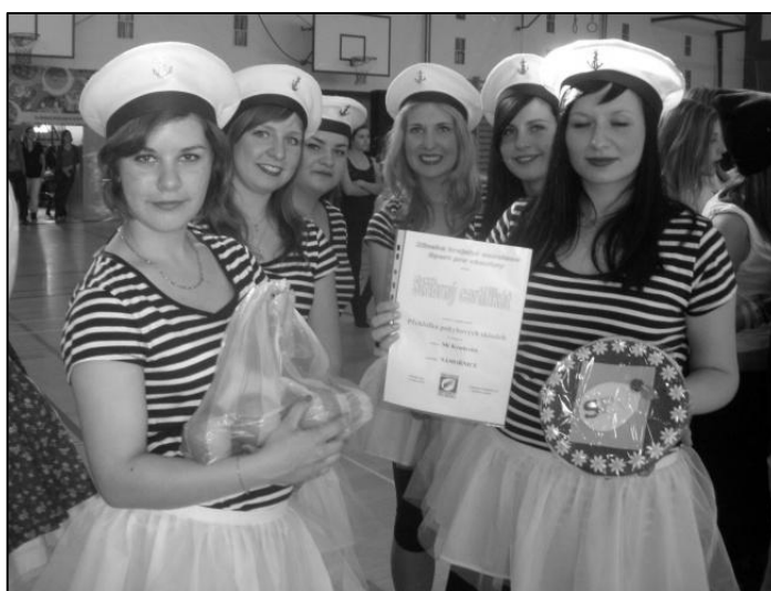
Ženy získaly na krajské přehlídce krásné stříbro.

Krajská přehlídka pohybových skladeb ČASPV se v letošním roce konala z důvodu úspory finančních prostředků v Otrokovicích, a to v neděli 4. května 2014. Sportovní klub Kyselovice na této přehlídce reprezentovaly všechny čtyři letos nacvičené pohybové skladby. Ve sportovní hale u Štěrkošově předvedli během celého odpoledne celkem 37 pohybových skladeb cvičenci z celého