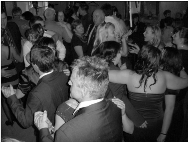
Obecní ples se vydařil, na tanečním parketu bylo plno.