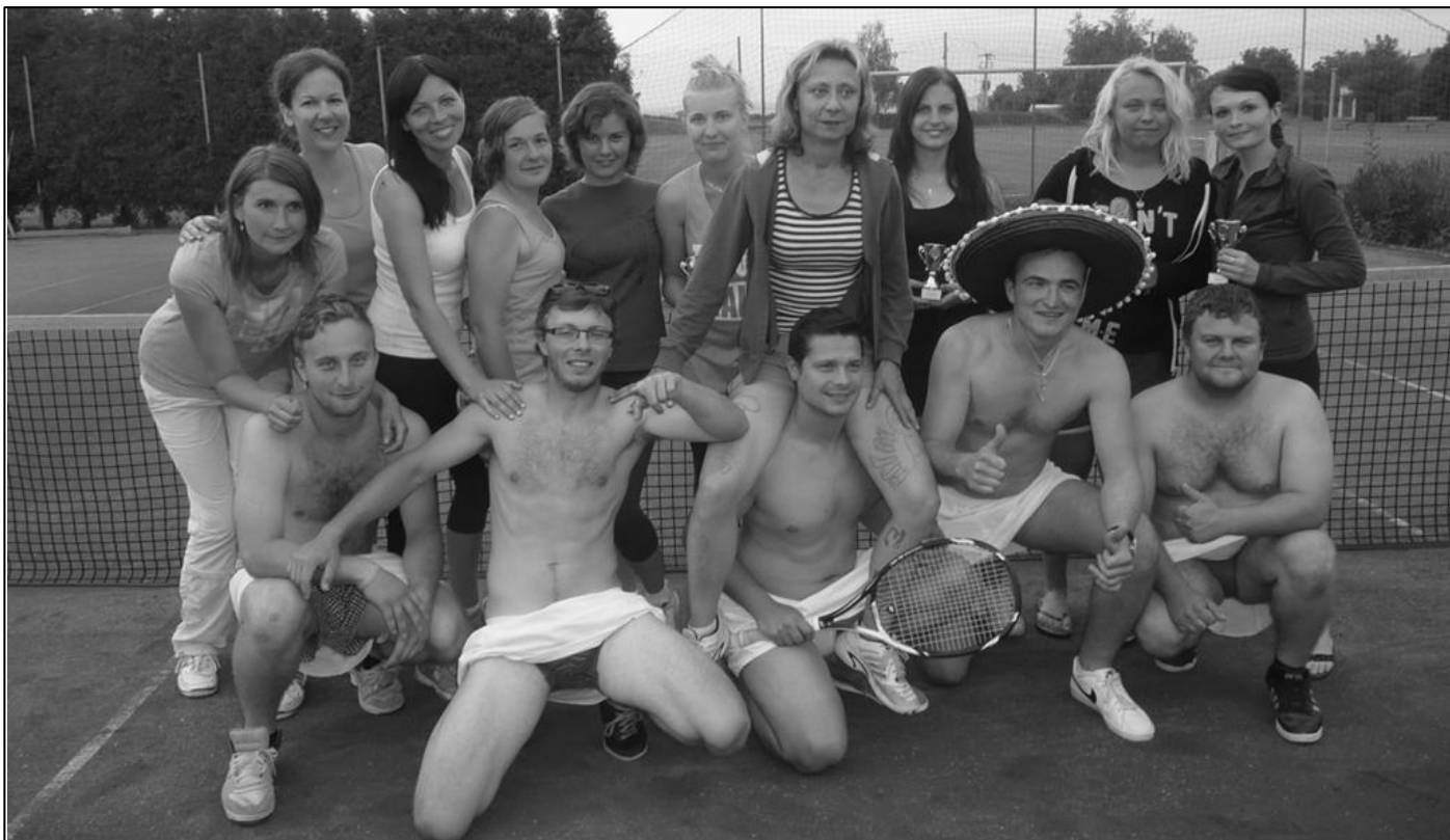
Společný závěrečný snímek z tenisového turnaje žen v Kyselovicích pořádaného v sobotu 5. července 2014.