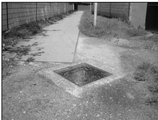
Odcizený poklop znamená ohrožení pro občany a zejména pro děti.

Ve středu 28. května 2014 byl v obci Kyselovice odcizen poklop na zatrubněném potoku Mlýnský náhon. Stalo se to mezi 13 a 14 hodinou odpoledne, v místě u garáže pana Luňáka u čp. 76. Starostka nahlásila krádež na Policii ČR a obecní pracovník místo provizorně přikryl a zabezpečil. Šachta se nachází uprostřed pěší komunikace, po které navíc vodí rodiče své děti do místní mateřské školy. Proto byla policie upozorněna na to, že odcizením poklopu hrozilo občanům obce Kyselovice obecné ohrožení. V té době byl navíc Mlýnský náhon po deštích plný vody a jen díky velikému