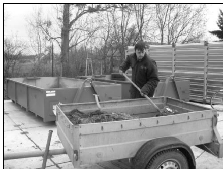
Odpadové centrum je našimi občany velmi využíváno.

V roce 2012 obec vybuďovala Odpadové centrum Kyselovice, sestávající ze sběrného dvora a komunitní kompostárny. Sběrný dvůr byl vybaven sběrnou nebezpečných