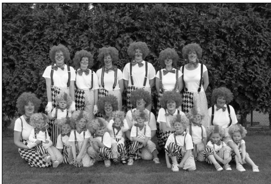
Společný snímek z Dne matek v Kyselovicích. Rodiče s dětmi předvedli velmi úspěšnou skladbu Veselí šášové.

Jako každý rok, tak i tenhle ten jsme se už v lednu v našem malém cvičení soustředily na přípravu pódiové skladby, kterou není tak jednoduché