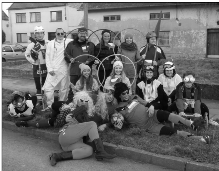
Velmi silným podnětem pro výrobu masek byla tentokrát Zimní olympiáda v Soči.