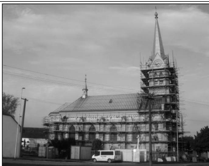
Při opravě obepínalo ocelové lešení celý kostel.

Římskokatolická farnost Kyselovice srdečně děkuje všem dárcům za jejich příspěvky.