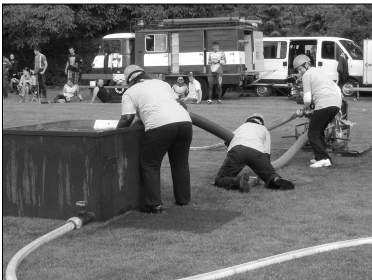
Družstvo žen SDH Kyselovice při požárním útoku v soutěži v rámci oslav 125. výročí založení hasičského sboru v naší obci.

Sbor dobrovolných hasičů Kyselovice se ujal v letošním pořádku 1. kola soutěže hasičských družstev v požárním sportu okrsku Chropyně a souběžně s 1. kolem soutěže se uskutečnila soutěž v požárním útoku v rámci připomenutí výročí sboru. Kromě družstev okrsku – Chropyně, Plešovice, Zářiči, Žalkovic a domácích, byla přizvána družstva mužů a žen z Vlkoše a Břestu. Akce se uskutečnila v sobotu 31. května 2014 ve sportovním areálu. V mužské kategorii zápolila družstva okrsku Chropyně vyjma hasičů z