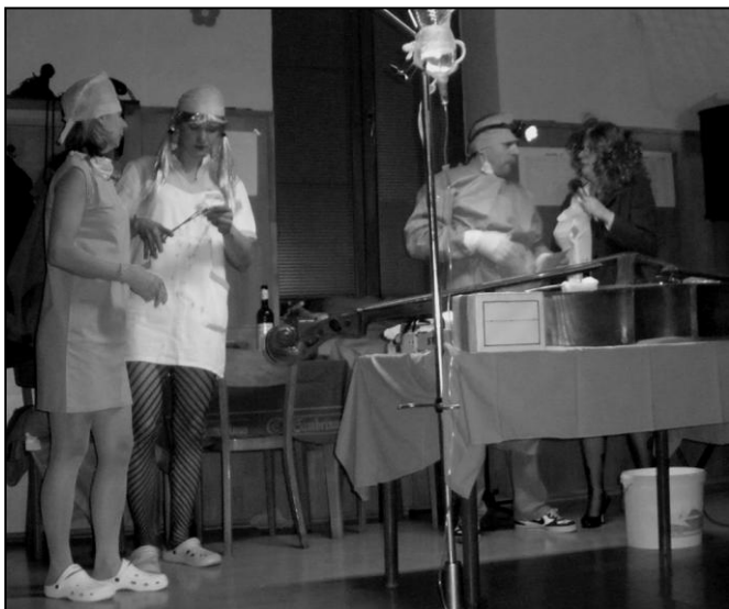
Pochovávání basy je v Kyselovicích již neodmyslitelnou součástí masopustního veselí.

svými rtíky. Medvědi byli letos hodní, jen občas se poprali s drakem. Počasí bylo poměrně teplé, takže trpaslíkům bylo horko, jen zdravotní sestřičky v punčoškách mrzly nohy.