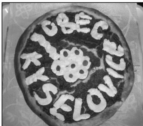
Nápadité ženy upekly pro hodnotitelskou komisi speciální hanácký vdolek.

V silné konkurenci známých obcí získala také obec Kyselovice v této