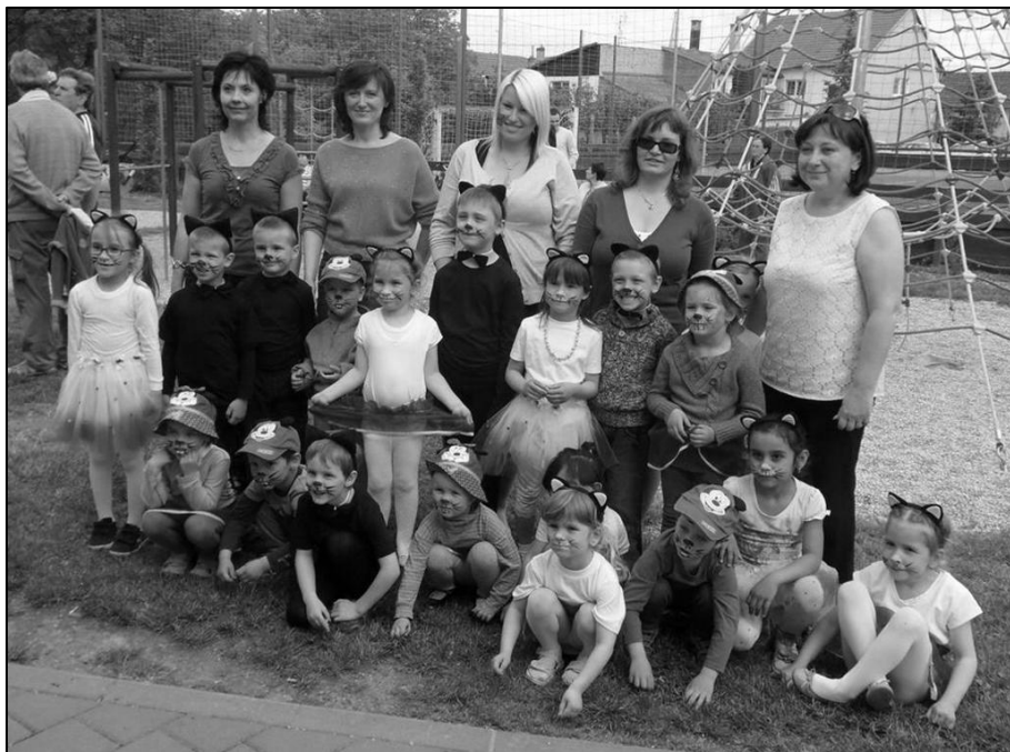
Mateřská škola Kyselovice na Dnu matek v areálu sportovního klubu.

pěkná vánoční výzdoba umocnila náš nevšední zážitek.