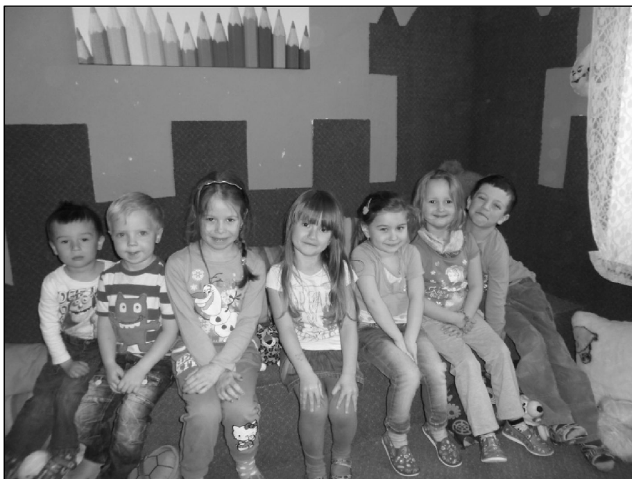
Děti z mateřské školy při návštěvě Obecní knihovny Kyselovice.

závěr dostaly maminky krásný dáreček, kytičku a sladkou pusu.