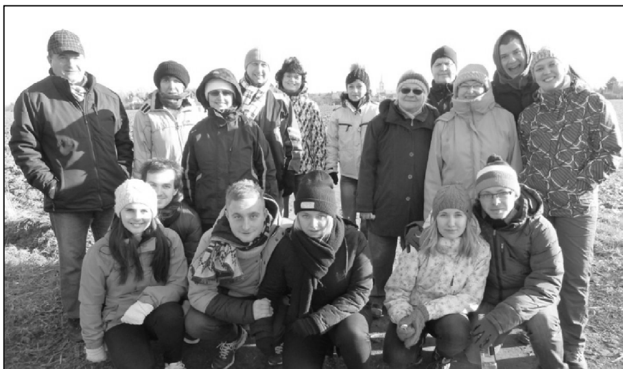
Účastníci prvního ročníku Silvestrovského výšlapu

Poslední den roku 2015 uspořádal Sportovní klub Kyselovice pro všechny milovníky turistiky první Silvestrovský výšlap. Trasa vedla přes les do Záříčí do penzionu U Kryštofa a zpět, celkem tedy cca 8 km. V loňském roce tuto trasu na Silvestra vyzkoušela menší skupina kyselovských turistů, aby zjistila, jak je trasa náročná a kolik zabere času. V penzionu U Kryštofa se pak setkali s početnou skupinou chropyněských turistů, kteří do Záříčí míří na Silvestra každý rok. Procházka se všem moc líbila, jedna cesta trvala jen cca 45 minut, proto byla dalšího Silvestra pozvánka na výšlap zveřejněna, aby se mohli přidat další zájemci. Na srazu u studny se nakonec sešlo sedmnáct turistů. Na cestu krásně svítilo sluníčko a přesto, že nebyla nějaká třeskatá zima, občas se všichni zastavili na tzv. zahřívací zastávku. U Kryštofa jsme se opět setkali se skupinou turistů z Chropyně a vzájemně si ochutnali