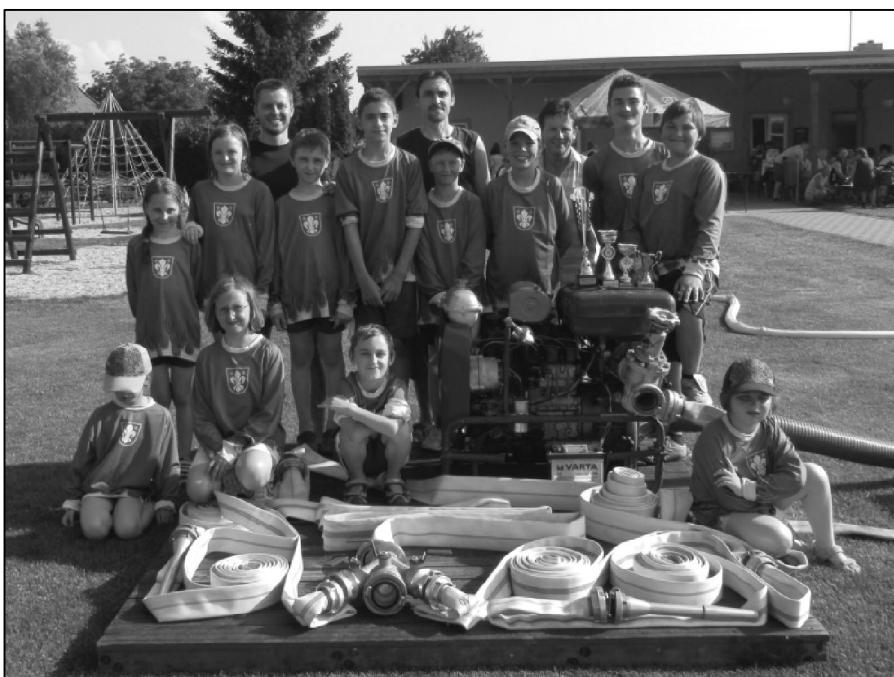
Mladí kyselovičtí hasiči v nových dresech na společném snímku i se svými vedoucími.

V pátek 24. června 2016 jsme se sešli na hřišti SK, abychom soutěžní sezonu společně ukončili. Pozvali jsme i rodiče, abychom jim ukázali požární útok. Hned na začátku jsme udělali společné foto v nových dresech, které jsme získali díky iniciativě rodičů. Rodiče nám v letošní sezoně navíc uhradili nákup opasků.