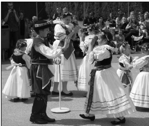
Kyselovský Hanáček vystoupil na Dnu matek s Hanáckou besedou.