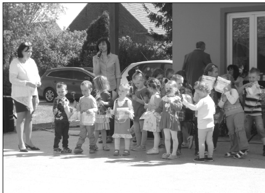
Den matek v areálu Sportovního klubu Kyselovice. Každé dítě drží v ruce kytičku, dárek pro svou maminku.

Ve středu 2. června jsme v rámci dne dětí navštívili jezdeckou stáj v Těšánkách. Po dobré svačince si děti