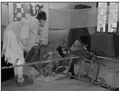
Herci divadla Klaunika Brno zahráli v R-Klubu komedii Don Quijote de la Ancha.

První březnovou neděli, 6. března 2016, jsme měli možnost zhlédnout v místním R-Klubu komedii Don Quijote de la Ancha, kterou si pod režijním vedením Bolka Polívky nastudovalo divadlo Klaunika Brno. Hlavní hrdiny představovali 2,38 metrů vysoký profesor španělského jazyka, který ztvárnil Dona Quijota a 120 kilogramová Ancha pracující jako vychovatelka na kominickém internátě ve Šlapanicích, která ztvárnila Sancho Panzu. Všichni přítomní diváci se stali profesorovými studenty a především ti v předních