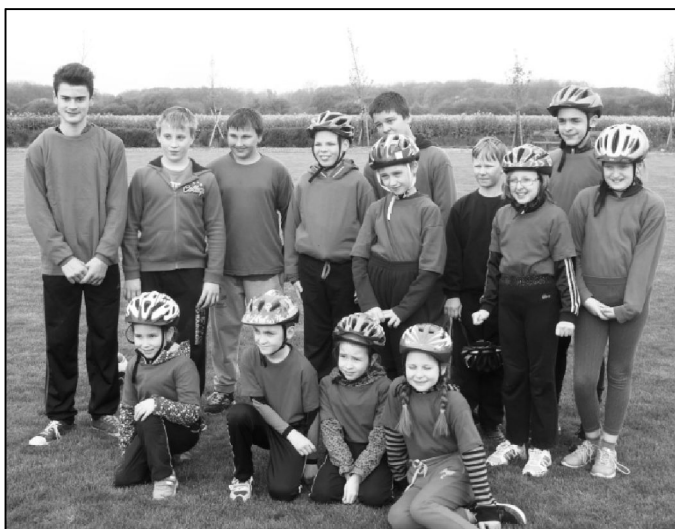
Na společném fotu mladí Kyselovičtí hasiči na soutěži O zlatou proudnici Hané v Kyselovicích.

gratulace! Družstvo starších jediná chyba na štafetě 4 x 60 m překážek odsunula na 23. místo. Pravidla při