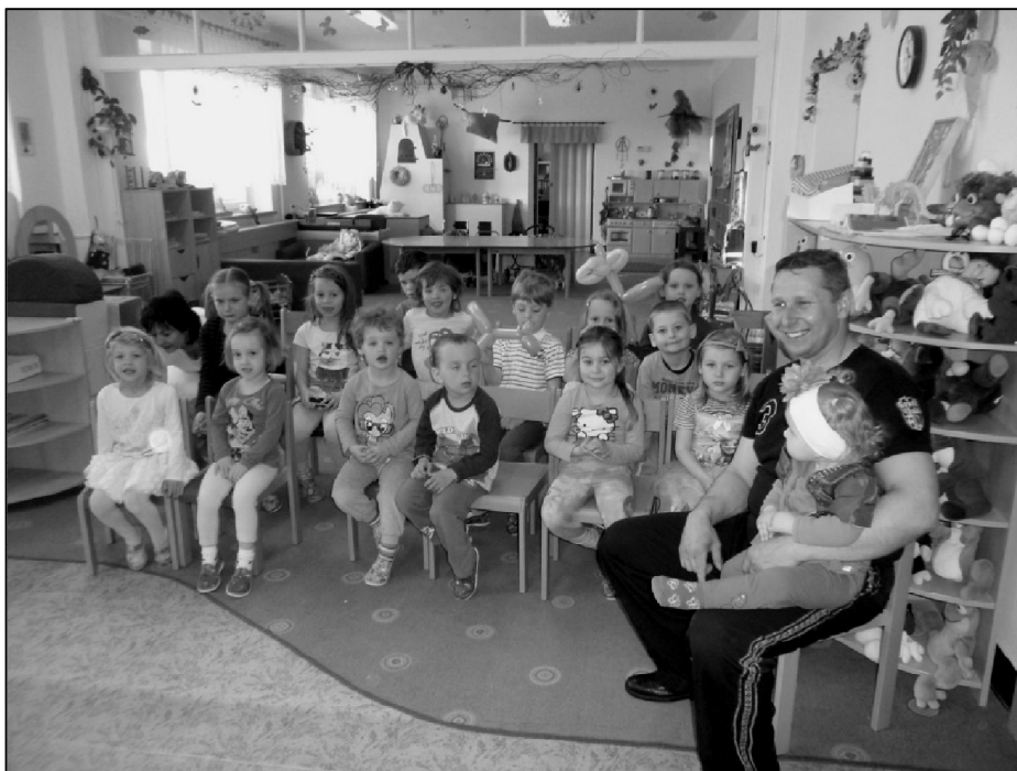
Cirkus Paldusovi v naší mateřské škole. Pro děti velmi oblíbená návštěva.

Následovala jízda na velkých koních, která byla pro děti nepřekonatelným zážitkem.