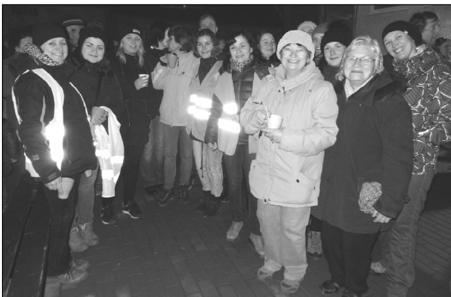
Kyselovská výprava na kotlíkovém svařáku ve Vlkoši.

Cvičení zralých žen stále pokračuje jedenkrát týdně v úterý od 19 do 20 h. Tento školní rok byla účast ve cvičení poměrně dobrá. Kvůli zdravotním potížím, nebo z důvodu různých lékařských zákroků některé cvičenky přerušily docházku, ale věříme, že se k nám zase po čase vrátí. V předvánočním čase ženy poseděly na společné vánoční besídce v R-Klubu, kam každý rok zavítá i Ježíšek a něco pěkného všem přinese. Vydaly se na kotlíkový svařák ve Vlkoši, kde si prohlédly i místní betlém a poslední den roku 2015 se připojily k Silvestrovskému výšlapu do Záříččí. Kdo by trasu nezvládl pěšky dorazil alespoň autem. V lednu se ženy už tradičně vydaly na Šibřinky do Vlkoše. V červnu se teplota v tělocvičně zvyšuje do nedýchatelných rozměrů, proto ženy zvolily místo cvičení raději projíždky na kole. Poslední úterý před prázdninami zakončily školní rok tradiční cyklo