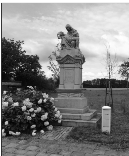
Socha Panny Marie sedmibolestné.