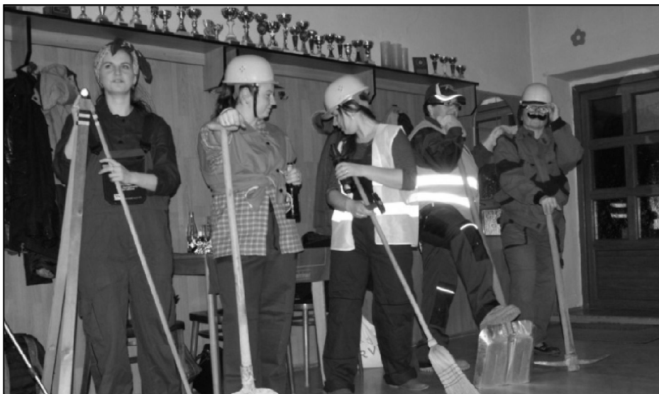
Tradiční pochovávání kyselovské basy v R-klubu bylo opět velmi zdařilé.