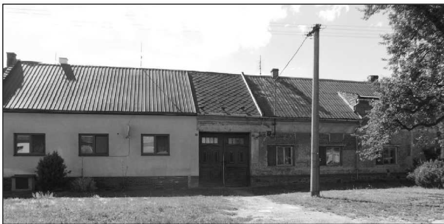
Současná podoba domů č. p. 93 a 129. Vrata jsou hodně stará, možná původní.

pantáti – sedláci a majetní. Ostatní návštěvníci museli klobouk smeknout. Na dvoře byla kuželna. V hospodě se