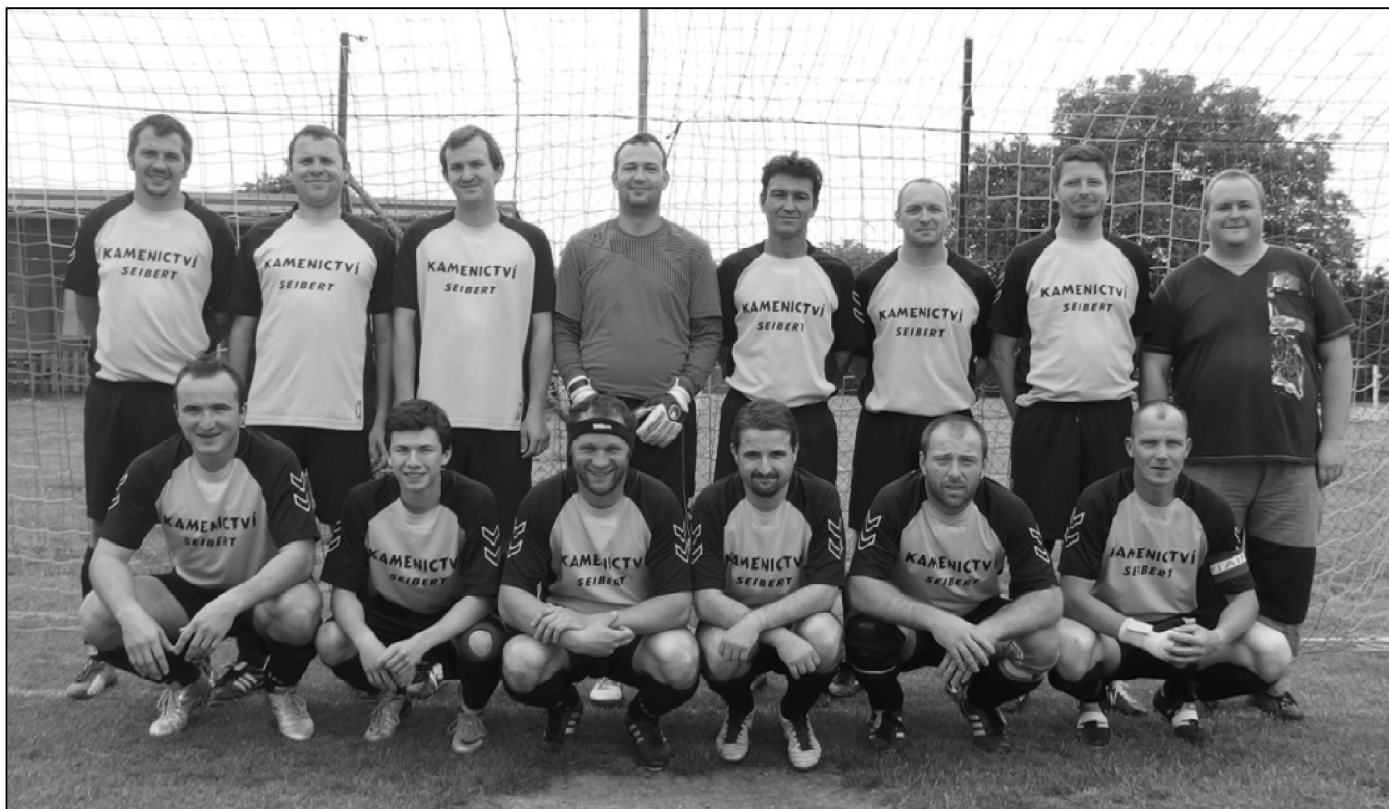
Poslední snímek B týmu Kyselovic 12. června 2016 před zápasem s TJ Sokol Rymice.

Podzimní sezónu jsme ukončili na osmém místě se ziskem osmi bodů a skóre 10:25. Zimní příprava pokračovala fyzickou přípravou na umělé trávě a