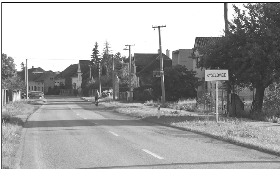
Začátek opravy silnice II. třídy č. 436 se blíží. Ve směru na Vlkoš je oprava velmi očekávaná.

V letošním roce se měla realizovat také akce napojovacích úseků se zpomalovacími ostrůvky na obou koncích obce na silnici II.třídy č. 436. Dle dohody o spolupráci při realizaci stavby těchto napojovacích úseků se správcem této komunikace se obec zavázala k investici ve výši 1,5 milionu Kč. Součástí realizace napojovacích úseků je také vybudování zastávkových