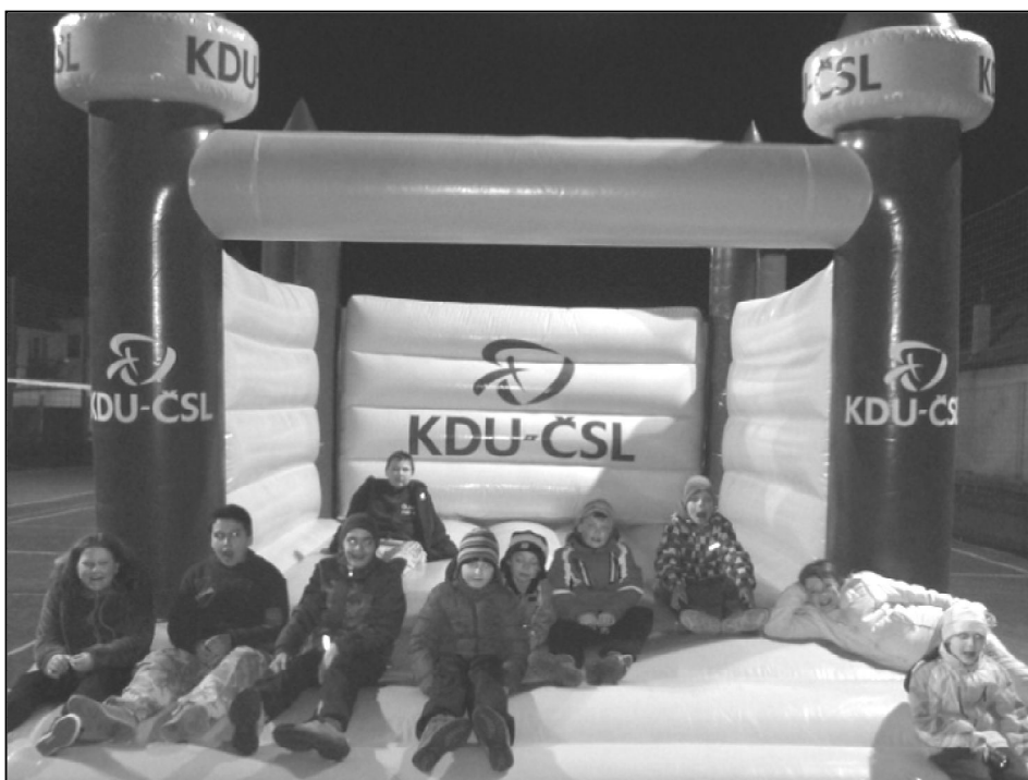
Děti si užily skákacího hradu.

Letošní noc s Andersenem byla zaměřena na místní pověsti. Minule děti navštívily krále Ječmínka v Chropyni. Dnes si poslechly pověst o