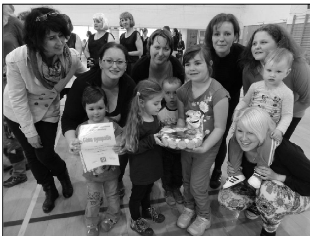
Na krajské přehlídce získali rodiče s dětmi krásný stříbrný certifikát a navíc cenu sympatie a sladký dort.

S Novým rokem 2016 přišla do našeho malého cvičení i příprava nácviku na novou pódiovou skladbu. Samozřejmě jsme nezapomínali cvičit na náradí, řídit při honičkách a různých pohybových hrách, ale jednu třetinu naší hodiny jsme věnovali nácviku naší malé pohybovky, kterou jsme letos pojmenovali „Barvy“, protože celý svět kolem nás je barevný a my jsme si ve skladbě s barvami hráli. K tomu nám sloužily pestrobarevné šátky, s kterými jsme cvičili a různě skotačili. I přes obtíže při nácviku jako jsou chřípky a neštovice, jsme na první letošní vystoupení vyrazili do Bystřice pod Hostýnem a to na okresní pódiové skladby. Soutěž se konala 3. dubna, tentokrát jsme se dopravovali vlastními