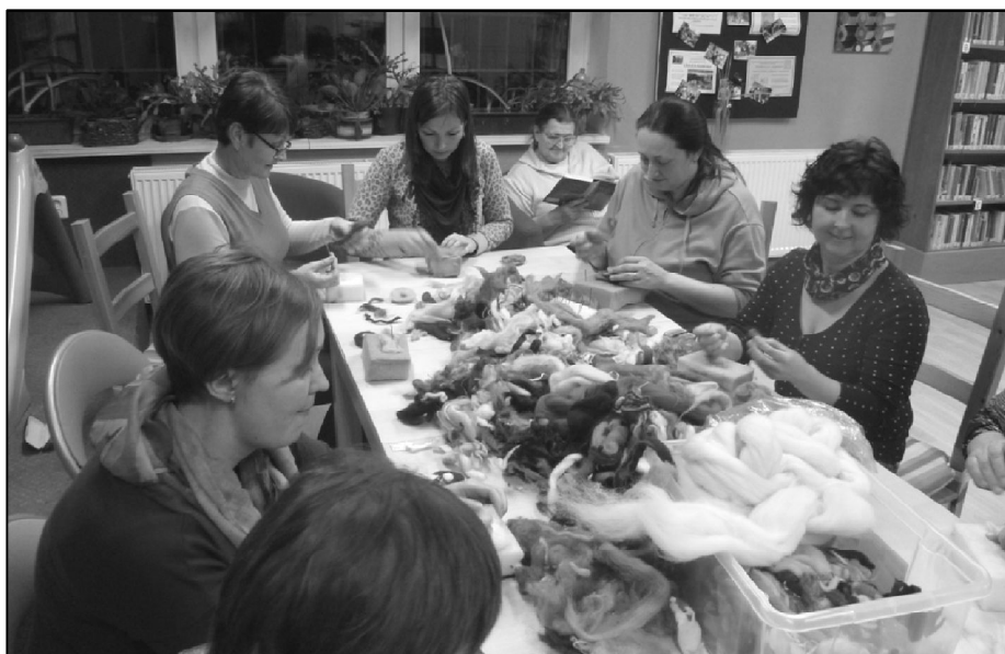
Místní ženy při výrobě brože technikou plstění za sucha.