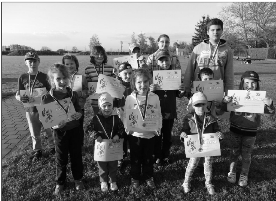
Všichni účastníci Kyselovské tretry dostali diplom a ti nejlepší opravdovou medaili.

V páteční podvečer 29. dubna 2016 se na hřišti v Kyselovicích závodilo v lehké atletice. Sportovní klub