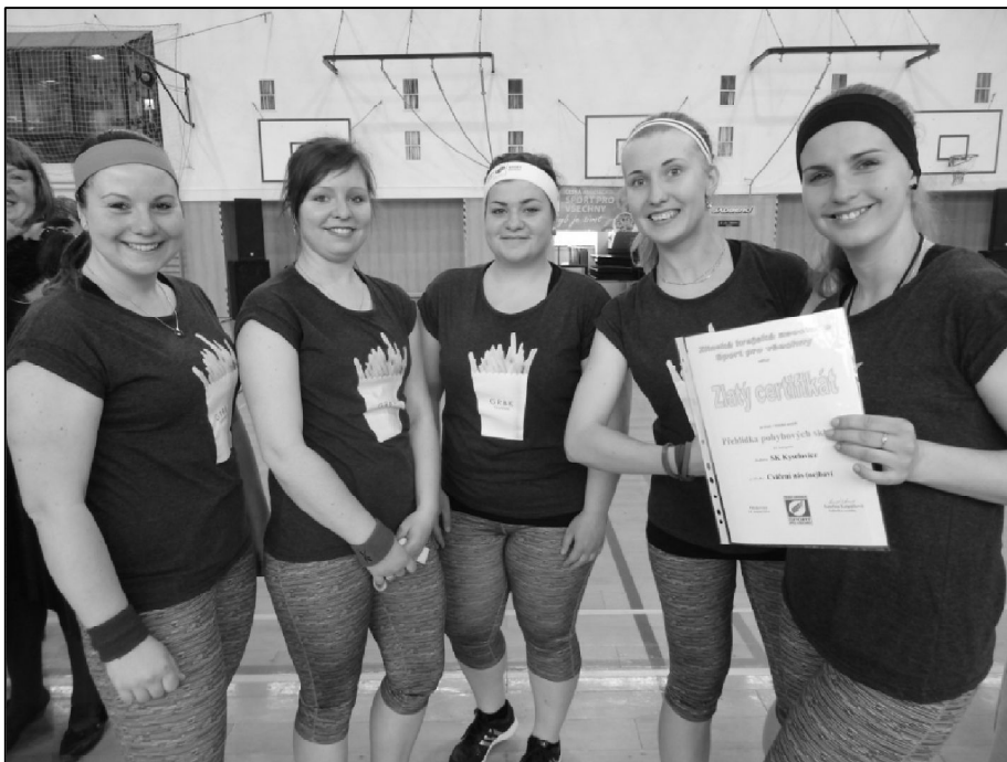
Na krajské přehlídce v Otrokovicích získaly ženy krásný zlatý certifikát.

Na krajskou přehlídku pohybových skladeb ČASPV do Otrokovic byl v neděli 24. dubna 2016 opět připraven společný autobus. Nasedli do něj cvičenci a jejich věrní fanoušci, kteří reprezentovali Sportovní klub