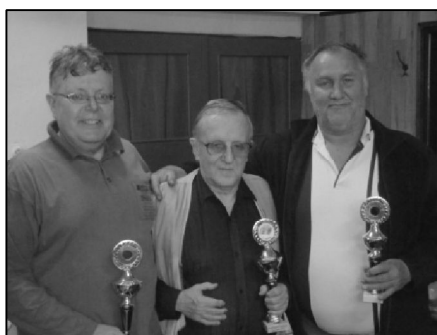
Na snímku hráči s poháry za první tři místa.