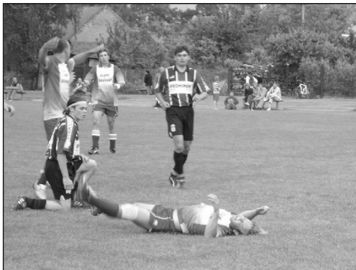
Zajímavá situace před brankou hostí v zápase hraném 5. června 2005.