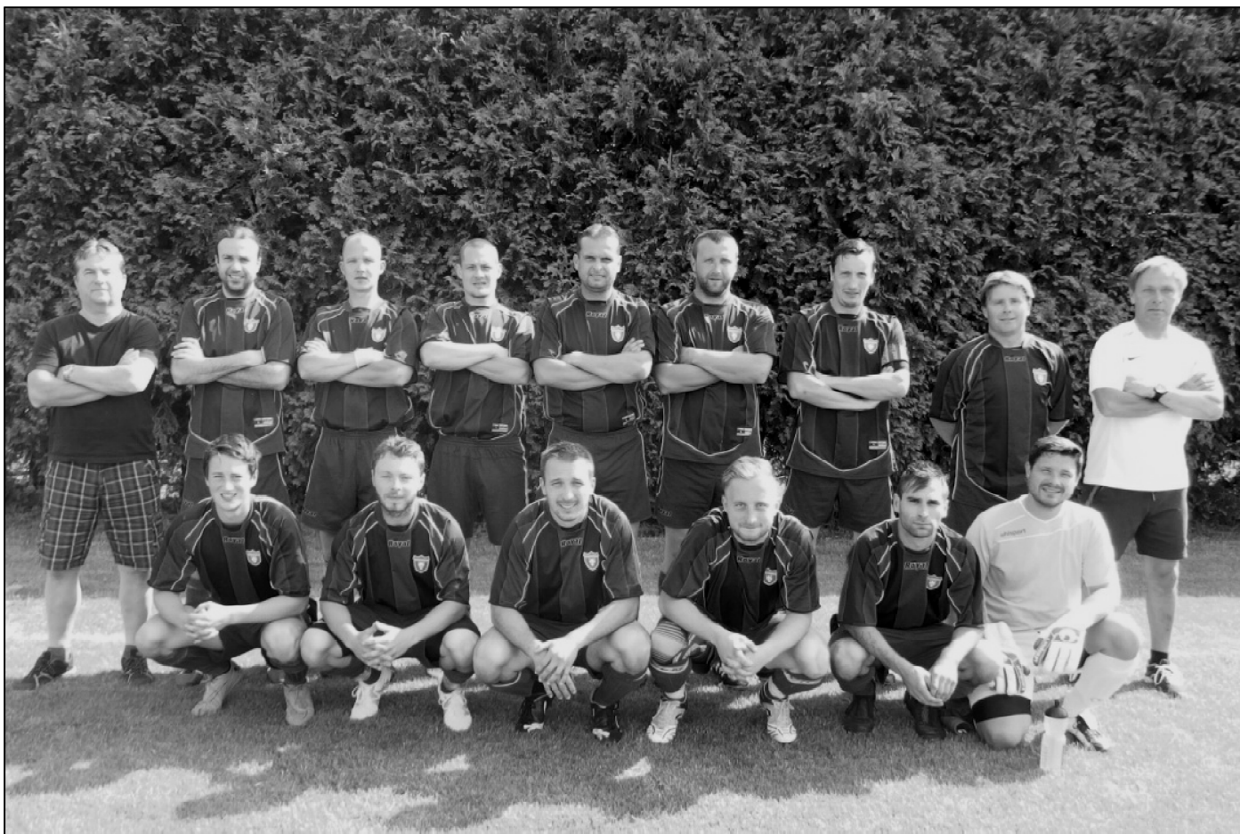
A tým Kyselovic před posledním zápasem okresního přeboru 12. června 2016. S TJ Počenicce prohráli 4:5.

Letošní sezóna se mi bude hodnotit jen velmi těžce, převážně proto, že po deseti letech opouštíme okresní přebor. Herně to nebylo špatné a měli jsme i spoustu dobrých okamžiků. Máme mladý kádr a dobrou partu, na čemž můžeme stavět a určitě budeme v budoucích sezónách bojovat o přední pozice v nižší soutěži. Co nás ovšem