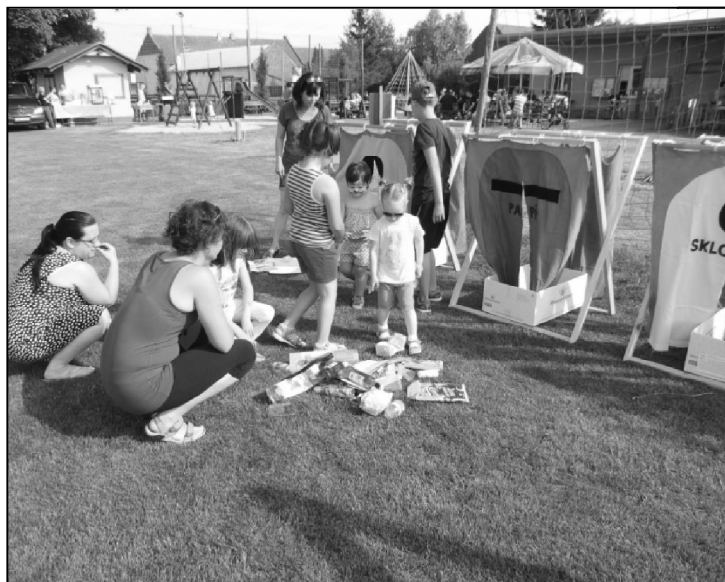
Na druhém stanovišti soutěže s ekologickou tematikou, měly děti za úkol správně roztrídřit připravené odpady.

odpoledne se o něho staral Ondra Lidák, kterým tímto děkujeme. Na závěr připravila Obec Kyselovice nejen pro děti překvapení v podobě vystoupení magického divadla Katonas z Brna. Na programu bylo vystoupení kouzelníka, břichomluvce, zpívajícího psa a další. Kouzelník do svých čísel aktivně