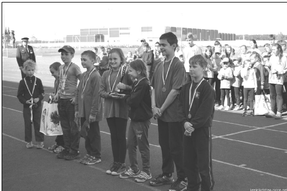
Úspěšné družstvo mladých hasičů Kyselovic s medailemi na krku za krásné 3. místo