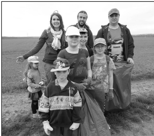
Na snímku jedna ze skupinek brigádníků u silnice II. tř. ve směru na město Chropyně.

V sobotu 16. dubna 2016 se obec Kyselovice opět připojila k celostátní akci „Uklidme svět, Uklidme Česko“. K úklidu polních cest v katastru obce Kyselovice se u odpadového centra sešlo na třicet účastníků. Pořadatelé tentokrát začátek brigády přesunuli na 14 h odpolední. Účastníci byli rozděleni do pěti skupinek, každá dostala mapku s vyznačeným okruhem polních cest, který je třeba obejít. Dále byli všichni vybaveni rukavicemi a dostatečným počtem plastových pytlů a mohlo se vyrazit. Počasí se vydařilo, sluníčko hezky svítilo a brigádníkům se pomalu začaly plnit pytle nalezenými odpadky. Mezi zajímavé nálezy patřila molitanová matrace, disk z auta a z místního potoka