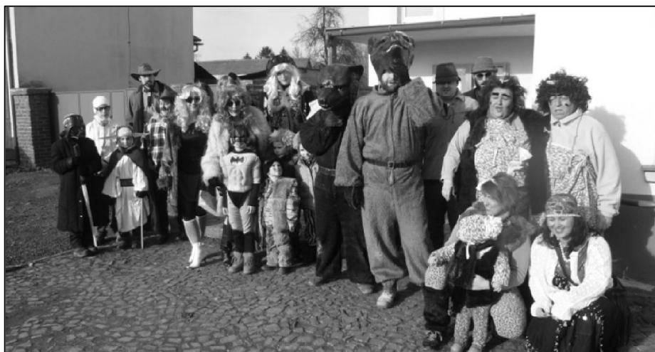
Společné foto z vodění medvědů v Kyselovicích.