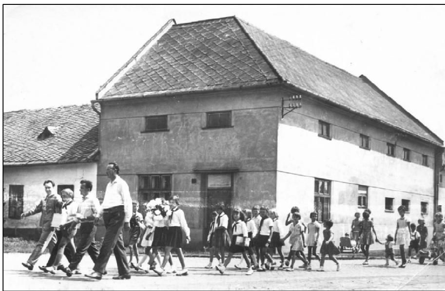
Dům č. p. 139 na snímku z roku 1964. Vlevo je vidět kousek obytné části.

Roku 1893 obecní (domovní) číslo 57 – bývalá palírna (Gořalna) a starý obecní hostinec bylo rozděleno na dvě