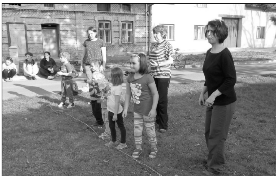
Jakmile se rozjaří, cvičení se přesouvá ven na sluníčko. Na snímku děti soutěží v hodu šiškami na návsi

K tradičním akcím našeho cvičení, které jsou u dětí oblíbené patří podzimní pečení brambor, výroba a