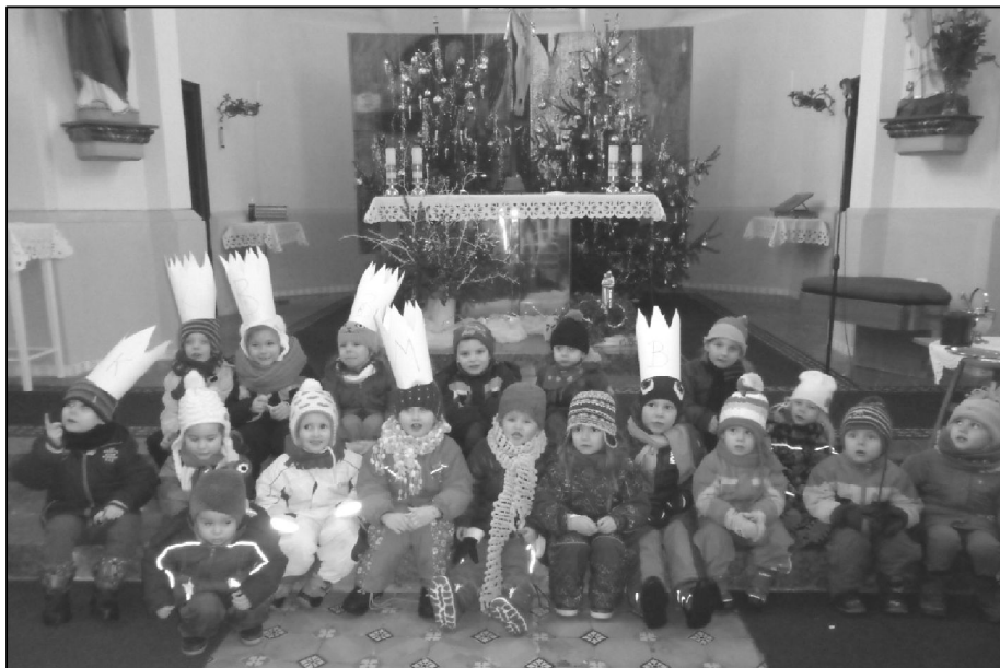
Děti z mateřské školy v kostele sv. Andělů Strážných v Kyselovicích.

Nový rok jsme v MŠ zahájili Tříkrálovým zpíváním v kostele sv. Andělů Strážných, které se stalo již tradiční akcí naší mateřské školy. Všechny děti představovaly mudrce nesoucí dary do Betléma právě narozenému Ježíškovi. Atmosféru