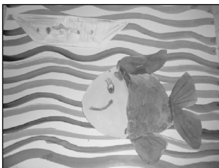
Ukázka výtvarné práce dětí ve školce.