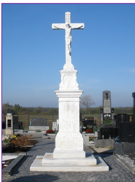
Kříž z carrarského mramoru pocházející patrně z roku 1900 stojící na hřbitově v Kyselovicích.