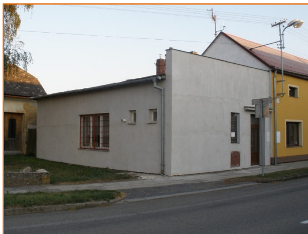
Takto vypadala knihovna před barevným nátěrem.

Obecní knihovna se pomalu stává důstojným kulturním stánkem naší obce. V letech 2008 – 2010 obec postupně upravila a zkulturnila její vnitřní prostory, po další opravě pak volala nevzhledná fasáda. Situace se stala akutní během roku 2010, kdy si majitelé vedlejšího domu č.p. 96 zateplili vnější plášť domu a pořídili novou barevnou fasádu. Nenápadná obecní knihovna se rázem stala výrazně ušmudlanou Popelkou. V rozpočtu obce byla proto v roce