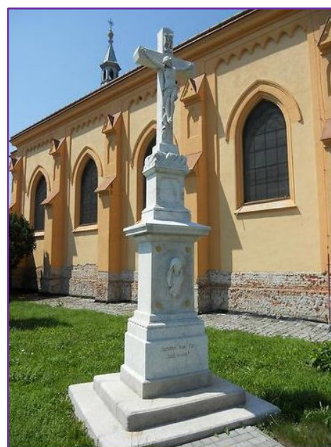
Krásný mramorový kříž z roku 1906 umístěný u kostela sv. Andělů Strážných.