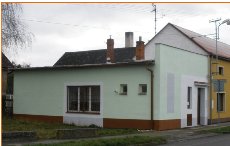
Nová fasáda knihovny v Kyselovicích.