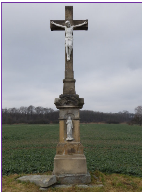
Kříž z roku 1894 stojí za obcí u cesty ve směru do Chropyně.