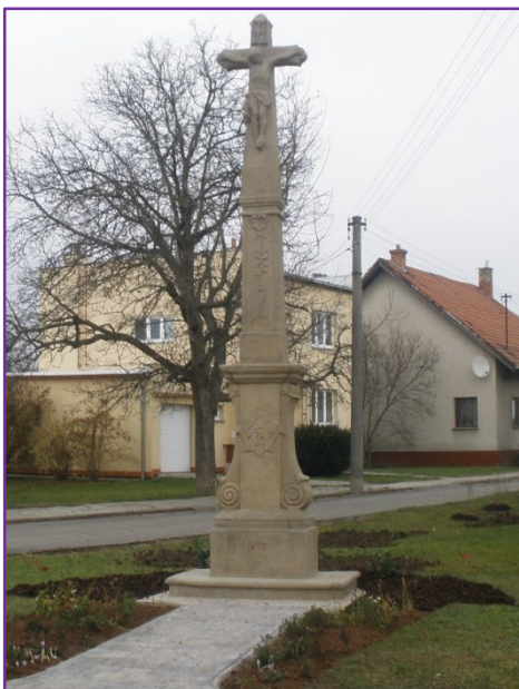
Krásný barokní kříž z roku 1769 stojící vedle domu číslo 205.