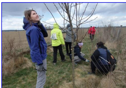
Na brigádě ženy stříhaly a ořezávaly mladé stromky.

náročné a velký dík patří všem zúčastněným. Ještě jednou moc děkuji za účast.