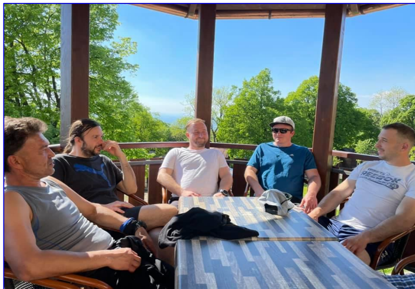
Letní počasí a společnou partu si hráči na soustředění užívali.

ochotní pro fotbal obětovat část svého soukromí a dát záruku, že budou na všech nebo alespoň většině zápasů. Což při různých pracovních povinnostech, případných zraněních není dostatečný počet. Spousta kluků již také je blíže či dále za hranicí čtyřicítka a mladí o sport obecně a fotbal ztrácejí zájem. Sice už to nebude ono, ale pokusíme se nějakou fotbalovou tradici udržet, alespoň přihláškou do Přerovské ligy malé kopané a snad si ještě pár let pro zábavu zahrajeme alespoň touto formou.