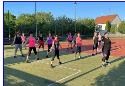
Ženy si letos čerstvé povětrí hodně užily - už od května cvičí venku na hřišti.

pouze za pěkného počasí. Je krásný pocít, když se k nám přidávají postupně nejmenší děvčátka školkového věku. K pohybu je potřeba vést děti od mala a