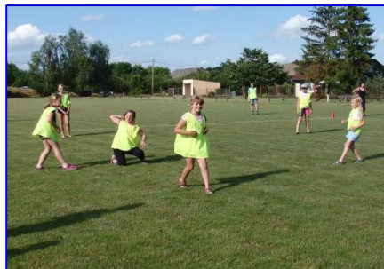
Mladší žáci v akci při hře brännball.

Po dlouhé koronavirové přestávce, jsme se sešli letos v červnu na hřišti. Hráli jsme různé hry s míčem, lanem, obručemi nebo padákem, hledali jsme a našli poklad od zajíce. Také jsme trénovali brännball na zápas, který pravidelně ukončuje školní rok a zahajuje prázdniny, ale hlavně - vítězové získají „opravdové medaile“. Zápas je odehrán, medaile rozdány a my přejeme