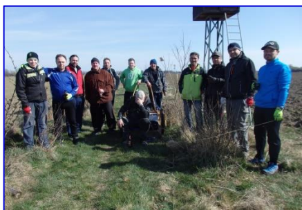
Společné foto účastníků druhé brigády v lokalitě „Za mlékárnou“.

Za povinnost jsem měl také seznámit výbor SK s postojem obce k údržbě sportovního areálu. Doposud údržba spočívala převážně v sečení fotbalového hřiště a okolního areálu. Sečení probíhalo po domluvě mezi předsedou SK a panem starostou obce bez jakéhokoliv