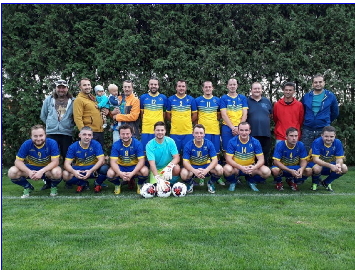
Škoda, že se fotbalová kapitola v Kyselovicích uzavírá. Můžeme jen doufat, že ne nadobro, protože ve vesnici, kde není fotbal „zdechl pes“. Fotbalové mužstvo z roku 2019.