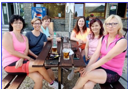
Společné foto účastnic cvičícího víkendu na Rusavě.

kend na Rusavu (někdo i na kolech). Víkend byl 2x odložený kvůli epidemiologické situaci, proto jsme byly rády, že na potřehtí to vyšlo :-). Kromě cvičebních lekcí nás čekala krásná příroda, dle zájmu wellness procedury, společné večírky a zpívání s kytarou. Samozřejmě nechyběl ani turistický výšlap na Hostýn. Opět jsme se přesvědčily o proměnlivosti počasí na horách, na zpáteč-