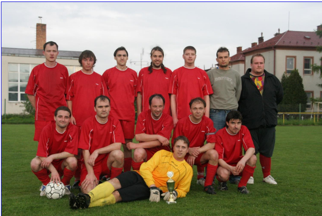
SK Kyselovice – vítěz poháru OFS Kroměříž několik sezón za sebou. Snímek z roku 2008.