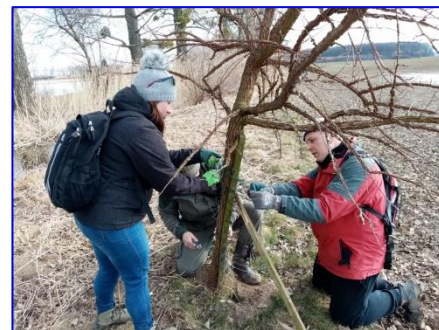
Odstraňování ochranných balů z pletiva v extravilánu obce

Mezinárodní den Rodiny, který připadá na 15. 5. 2021, byl tématem druhé bezkontaktní stezky („RODINNÉ PROCHÁZKY“), na kterou se mohli rodiče s dětmi vydat až do pondělí 17. 5. 2021. Start byl tentokrát u budovy bývalé školy, kde byla připravena křížovka čekající na vyluštění. Trasa byla značena obrázky s rodinnou tematikou, které nám děti namalovaly a vedla přes uličku, kolem zahrad ke hřbitovu a podél