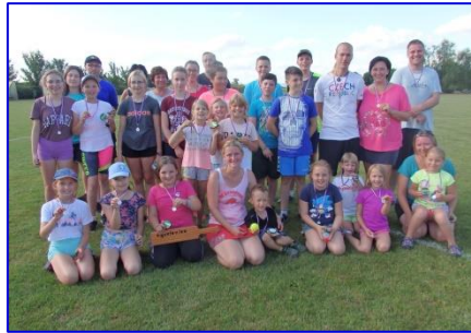
Společné foto účastníků turnaje v oblíbené hře brännball.

a mohutné povzbuzování kapitána. Do hry se zapojili i zjevně soutěživí tatínci, čímž získal turnaj na dramatickosti. Myslím, že kyselinu mléčnou odbourávali ze svalů určitě několik dlouhých dní. Při téměř oficiálních rozměrech hřiště nebylo jednoduché udělat tzv. „Home run“, tedy po odpálení oběhnout celé kolo, přesto se to alespoň jedenkrát na