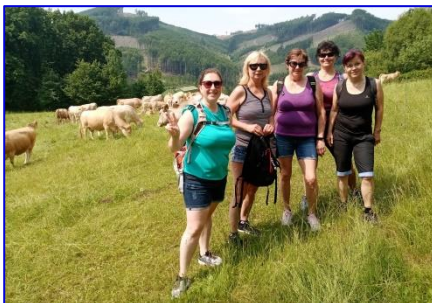
Výšlap na Hostýn vedl krásnou krajinou s rozmanitou flórou i faunou.

ní cestě nás chytila bouřka, při které na nás nezůstala ani nit suchá. ...Kdo se potřeboval při návratu zpět zahřát, čekal ho dynamický kruhový trénink. Po tak dlouhé době bylo příjemné sejit se se známými lidmi a užít si relax v přírodě.