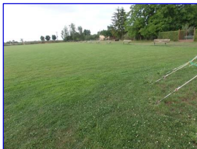
Sečení fotbalového hřiště si musí nově zabezpečovat sportovci sami.

problému. Snažil jsem se zbytečně nezatěžovat obec a volal jen, když to bylo nezbytně nutné. Nicméně v době „pandemické“ se postoj pana starosty změnil a bylo mi řečeno, že obec nadále fotbalovou plochu udržovat nebude. A to zejména proto, že obec jako správný hospodář nemůže udržovat cizí pozemek bezplatně bez nějaké písemné smlouvy. Na to jsme s panem starostou hledali nějaké východisko z této situace. Po těžké diskuzi vzešel návrh uzavřít smlouvu mezi SK a Obcí Kyselovice na údržbu (sekání) fotbalového hřiště, tzv. Smlouvu o spolupráci. Smlouva spočívá v tom, že obec se zavázala posekat hřiště před každým domácím mistrovským zápasem. Zdálo se, že vše bude fungovat jako dřív. Fotbalová soutěž se však nerozběhla a nám nezbylo nic jiného, než si fotbalové hřiště udržovat (sekat) vlastními silami. Jelikož SK nedisponuje technikou na sečení velké plochy, tak jsme požádali pana starostu o zapůjčení sekačky ve vlastnictví obce. Pan starosta žádosti vyhověl a tak současný stav sečení je takový, že obec půjčí bezplatně sekačku a SK travnatou plochu fotbalového hřiště a přilehlý