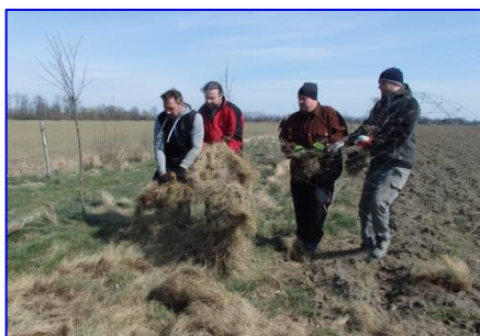
Při další brigádě se odstraňovala oplocenka. Na snímku vytrhávají fotbalisté zarostlé pletivo.