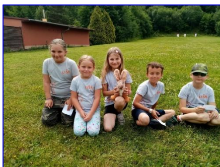
Okresní kolo soutěže Zlatá srnčí trofej

Letošní školní rok nebyl díky nepříznivé epidemiologické situaci volnočasovým aktivitám vůbec nakloněn a z důvodu vládních nařízení jsme bohužel nerealizovali žádné z pravidelných setkání. Přesto jsme nezaháleli a soustředili jsme naši aktivitu do přípravy stezek pro rodiče s dětmi v okolí naší obce, zapojili jsme se do péče o obecní zeleň v extravilánu obce a zúčastnili jsme se okresního kola soutěže „O zlatou srnčí trofej“.