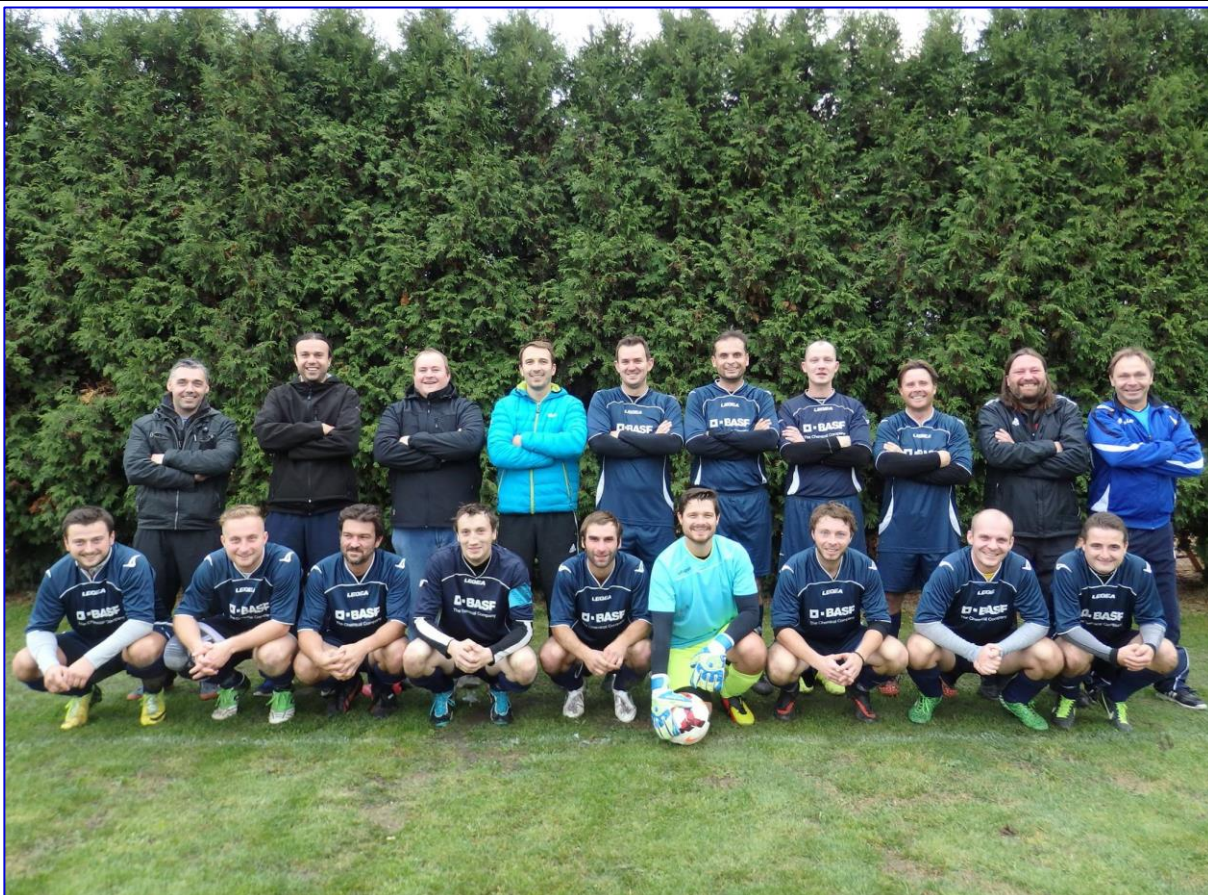
Fotbalové mužstvo SK Kyselovice 2012.