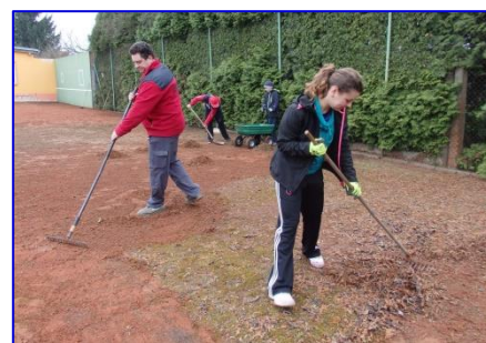
Díky velkému počtu brigádníků se letos podařilo nachystat oba tenisové kurty.

A to je v krátkosti vše z činnosti výboru SK. Na závěr mi dovolte popřát všem pevné zdraví a sportovní nadšení do