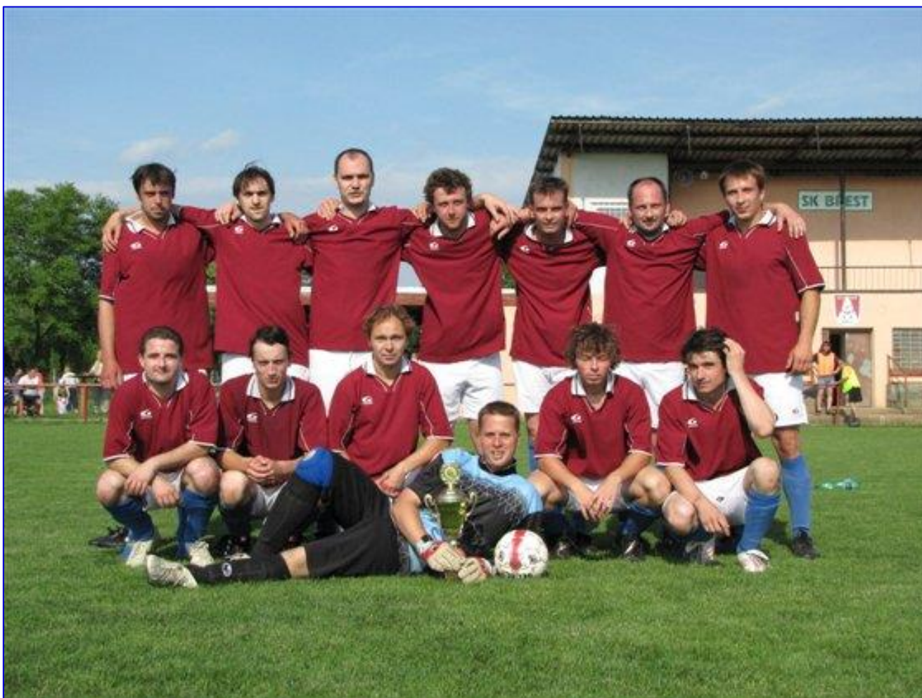
Vítěz poháru OFS Kroměříž 2010.