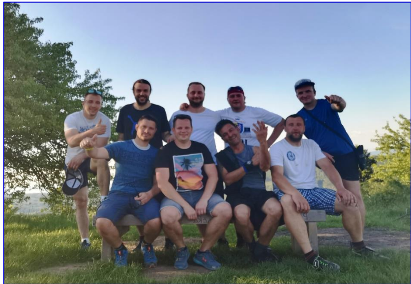
Společné foto účastníků zimního soustředění, které se nakonec konalo v červnu.

A teď bohužel k té smutnější části. První domluvené přátelské utkání s Říkovci nám nevyšlo, nenašli jsme společný termín. Další domluvený zápas s Vlkošem padl 4 hodiny před výkopem, když se nesešlo družstvo Vlkoše. Stejně jsme se sešli v kabinách a řešili přihlášku na další sezónu. Bohužel jsme se dopočítali cca 11 hráčů, kteří jsou